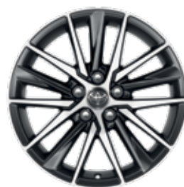
חישוקי סגסוגת קלה 18"