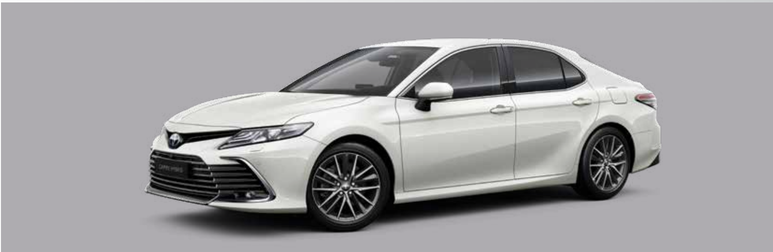
לבן פנינה מטאלי B-089