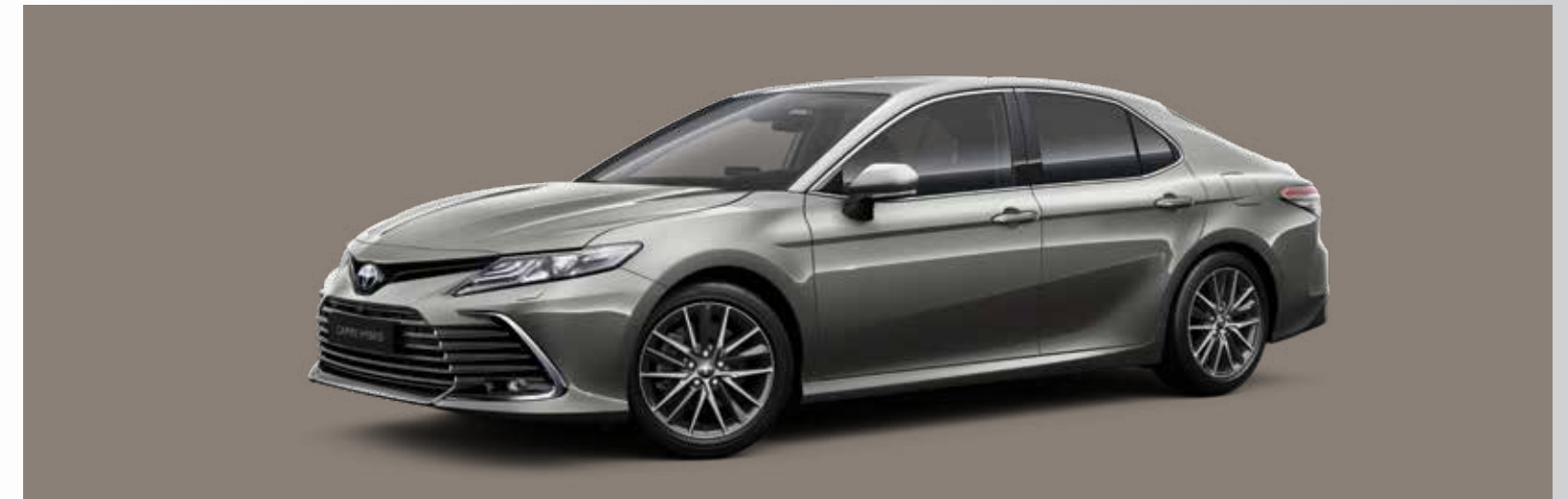
כסוף יוקרתי B-1L5