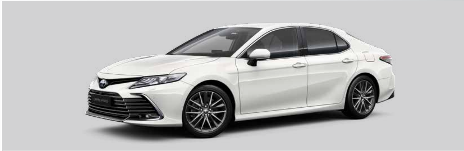
לבן צחור B-040