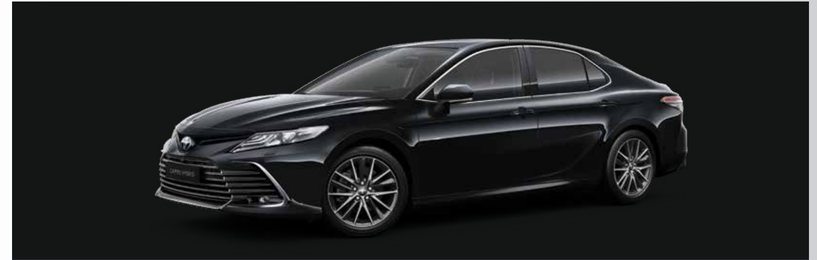
שחור מיקה מטאלי B-218