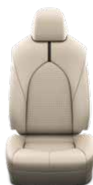
עור בהיר ריפוד עור בצבע בז', מגיע ברכבים עם צבע חיצוני לבן פנינה, שחור.