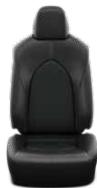
עור שחור ריפוד עור בצבע שחור, מגיע ברכבים עם צבע חיצוני לבן צחור וכסוף יוקרתי.