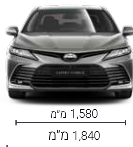
התמונות להמחשה בלבד.