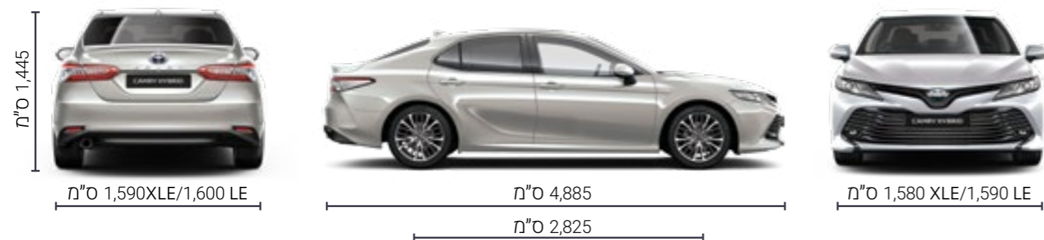
התמונות להמחשה בלבד.