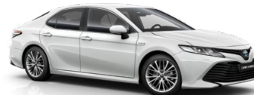
לבן פנינה מטאלי B-089