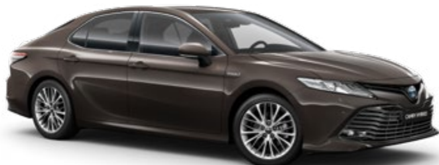
חום ברונזה מטאלי B-4X7