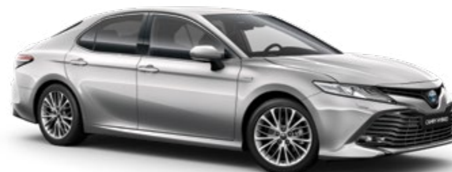
כסוף מטאלי B-1F7