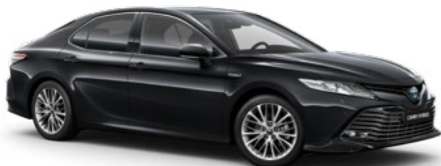
שחור מיקה מטאלי B-218