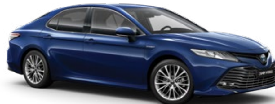
כחול כהה מטאלי B-8W7