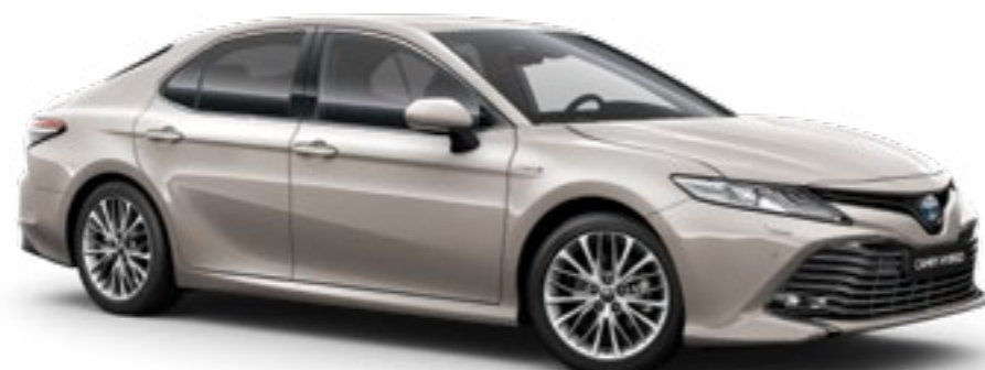
שמפניה מתכתי B-4X1