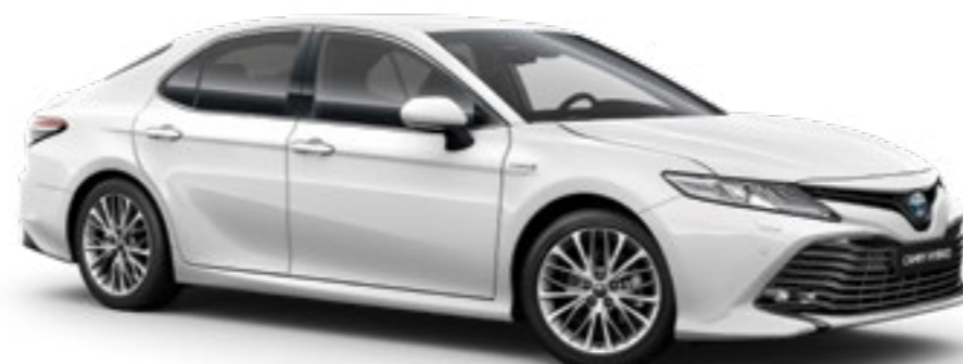
לבן צחור B-040