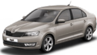
Cappuccino Beige metallic - 4K