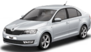
Brilliant Silver metallic - 8E