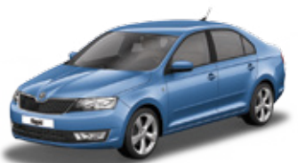
Denim Blue metallic - G0