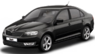
Black Magic pearl effect - 1Z