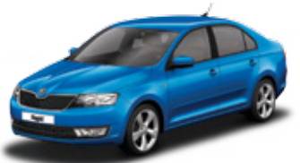
Race Blue metallic - X8