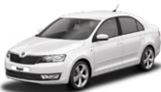
Candy White uni - 9P