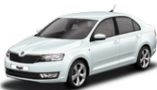
Moon White metallic - 2Y