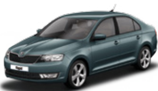
Metal Grey metallic - F6