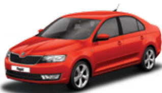
Rio Red metallic - 6X