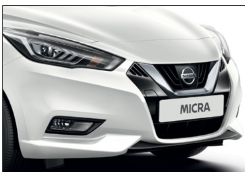
לבן פנינה מטאלי QNCK