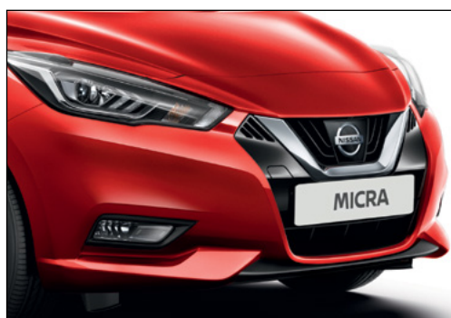
אדום שני מטאלי NBDK