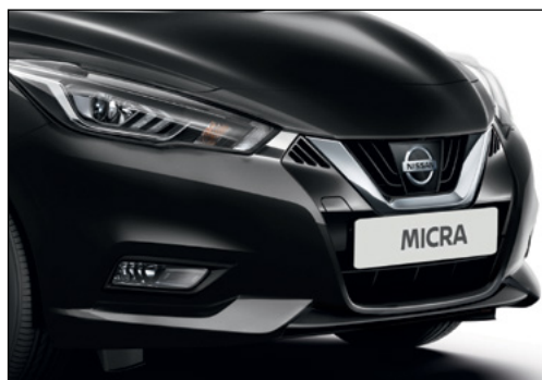
שחור מטאלי GNEK