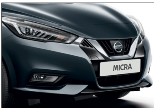
אפור כחול מטאלי KPNK