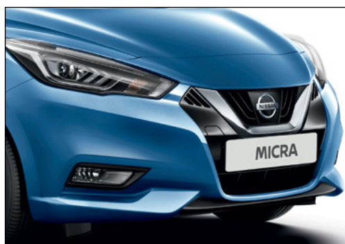
כחול אוקיינוס מטאלי RQ GK