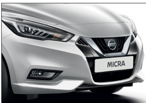
כסף מטאלי ZBDK