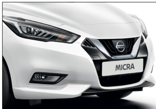
לבן צחור ZY2K