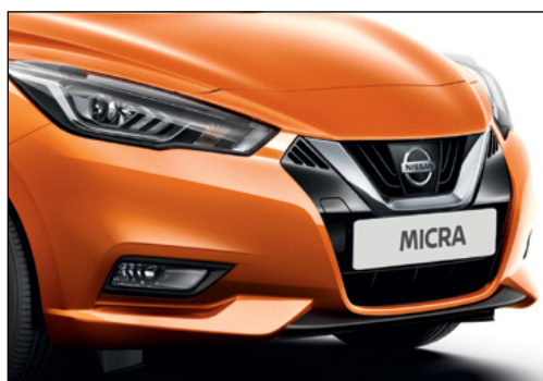
כתום ענבר מטאלי EBFK