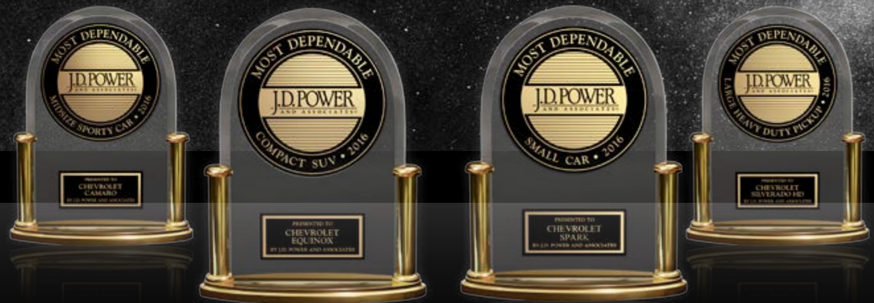
שברולט CAMARO זוכה בקטגוריית רכב הספורט לשנת 2016

שברולט היא הזוכה הגדולה של תחרות J.D. POWER 4 פסלונים ב-4 קטגוריות שונות. אנחנו גאים להמשיך ולהוביל במצוינות את תעשיית הרכב.