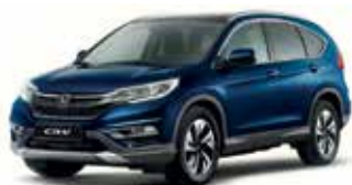
Deep Ocean Blue