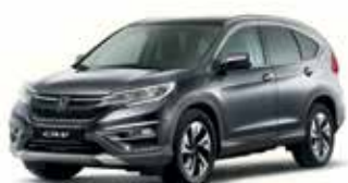
Polished Metal Metallic