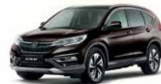
Golden Brown Metallic