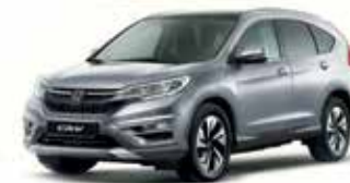
Alabaster Silver Metallic

*דוגמאות הצבעים והאביזרים מוצגות לשם המחשה בלבד. בשל מגבלות הדפוס, תכנה סטיות מהצבעים והאביזרים בפועל. מגוון הצבעים והאביזרים כפוף לשינויים על-פי מדיניות היצרן ולמגבלות המלאי.