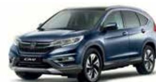
Twilight Blue Metallic