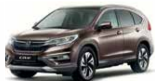
Urban Titanium Metallic