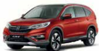
Passion Red Pearl