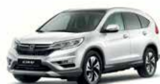
White Orchid Pearl