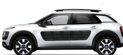
לבן | Air Bump | WPP0 | Blanc Banquise | שחור