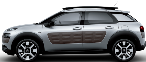
כסף מטאלי | Gris Aluminium | ZRM0 | Air Bump: שוקו