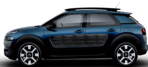
כחול | Baltic Blue | TMPO | Air Bump: שחור