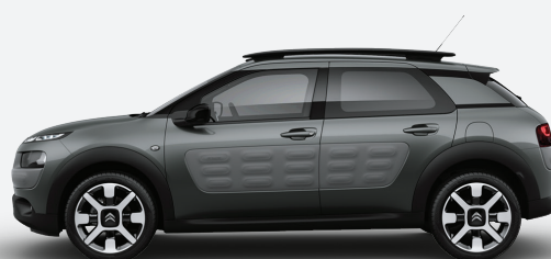
אפור כהה מטאלי | Air Bump | VLM0 | Gris Platinum | אפור כהה