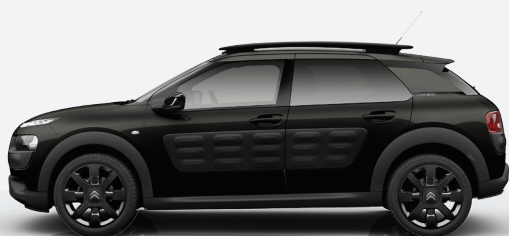
שחור | Air Bump | XLMO | Noir Obsidien | שחור