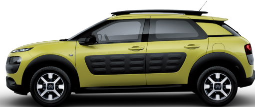
צהוב | Hello Yellow | NHPO | Air Bump: שחור