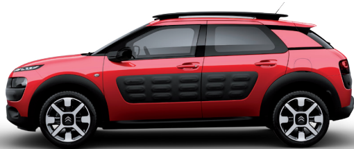
אדום | Rouge Aden | 1NPO | Air Bump: שחור