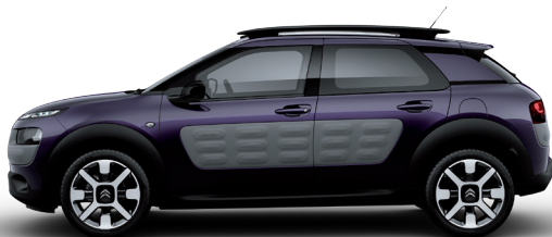
סגול מטאלי | Deep Purple | E3M0 | Air Bump: אפור כהה