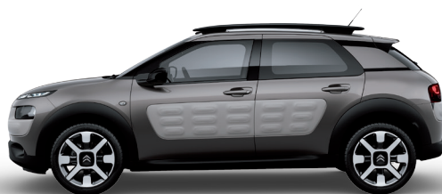
חום | Air Bump | K7PO | Olive Brown | אפור בהיר