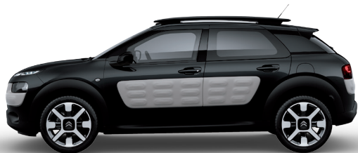
שחור | Air Bump | XLMO | Noir Obsidien | אפור בהיר