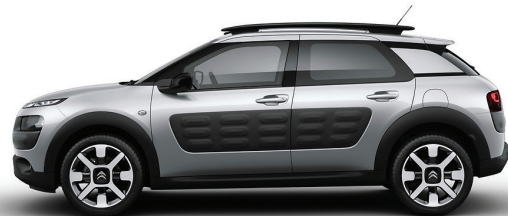
כסף מטאלי | Gris Aluminium | ZRM0 | Air Bump: שחור