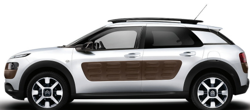
לבן פנינה | Air Bump | FCM6 | Pearl White | שוקו *בתוספת תשלום