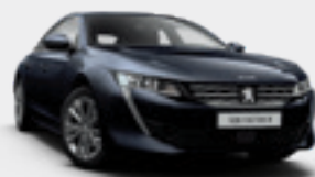
INK BLUE | כחול אנקר מטאלי | KUM0