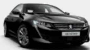
Noir Perla | שחור מטאלי | 9VM0