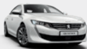
Blanc Nacre | לבן פנינה | N9M6