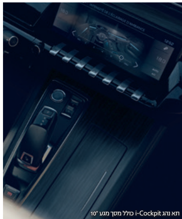
תא נהג i-Cockpit כולל מסך מגע 10"