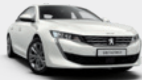
Blanc Banquise | לבן | WPPO