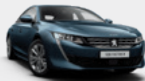
CELEBES BLUE | כחול מטאלי | SYM0