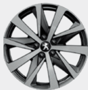
HIRONE 18" | חישוק סגסוגת PREMIUM | סטנדרט לדגמי