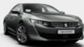
Gris Amazonite | אפור ירקרק מטאלי | KLM0