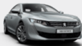
Gris Cumulus | אפור פלדה מטאלי | F4M0