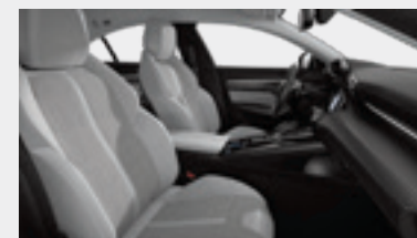
ריפוד פנימי וגימור דלתות בצבע אפור בהיר