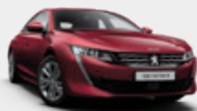
Red Ultimate | אדום מטאלי | F3M5