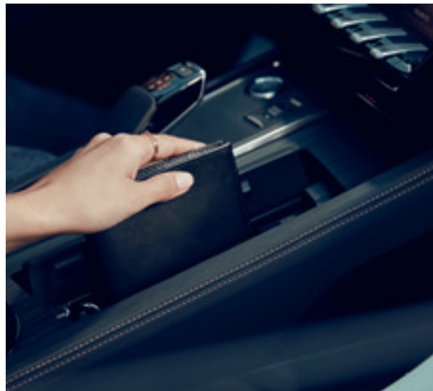
**ראה הערה בגב העלון