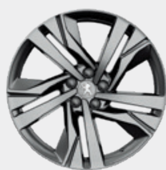
AUGUSTA 19" | חישוק סגסוגת GT | סטנדרט לדגמי