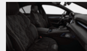
מושבים בריפוד עור Mistral Nappa משולב אלקנטרה