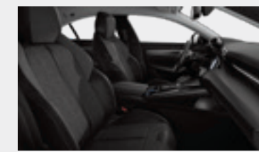
ריפוד פנימי וגימור דלתות בצבע אפור כהה