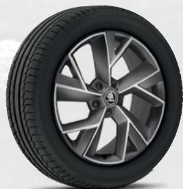
רמת גימור Sportline 19"