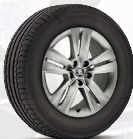
רמת גימור Business 17"