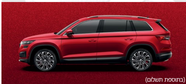
(K1) VELVET RED METALLIC