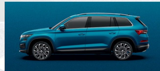
(0F) LAVA BLUE METALLIC