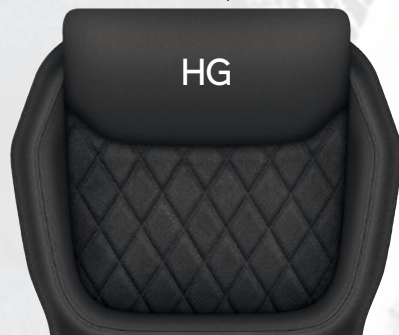
ריפודי אלקנטרה בשילוב עור