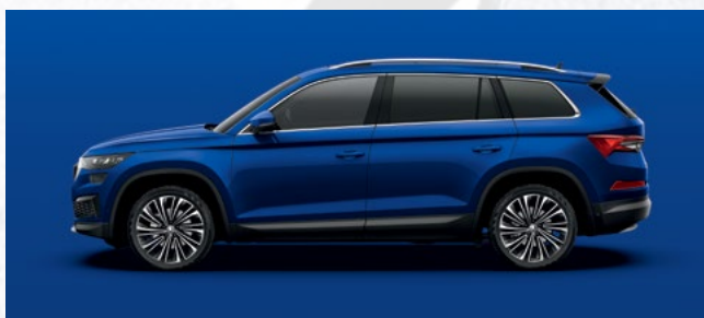
(4K) ENERGY BLUE UNIWHITE