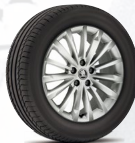
רמת גימור Style 18"