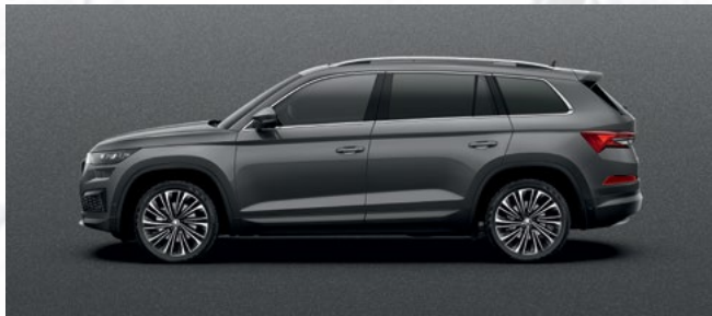
(5X) GRAPHITE GREY METALLIC