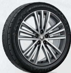
רמת גימור L&K 19"