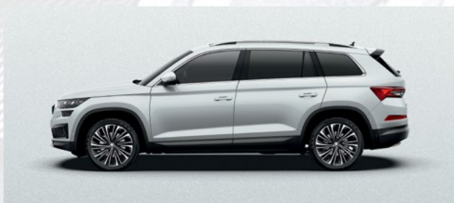
(8E) BRILLIANT SILVER METALLIC