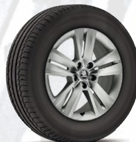
רמת גימור Ambition 17"