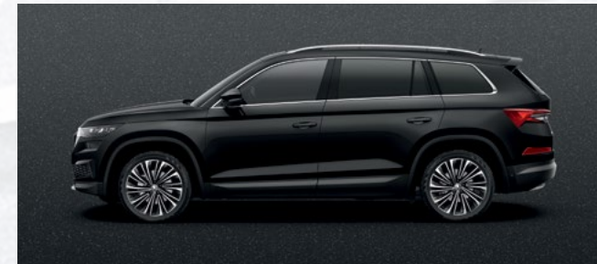
(1Z) MAGIC BLACK METALLIC