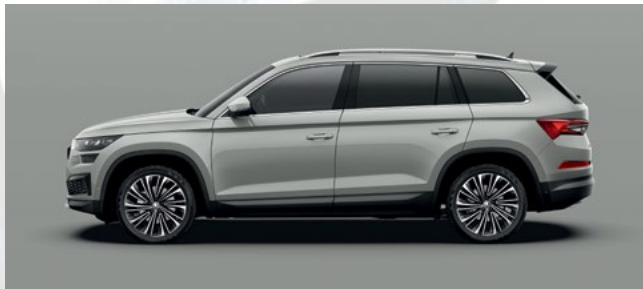
(M3) STEEL GREY UNI