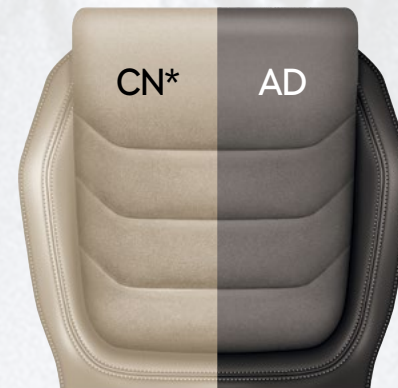
*תוספת תשלום לריפודי עור