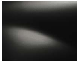
שחור פנינה מטאלי (676)