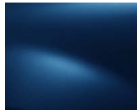
כחול מטאלי (RPR)