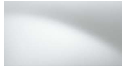
לבן קרח (369)