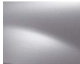
כסף מטאלי (KQA)