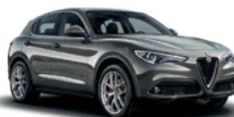
318 אפור מגנזיום