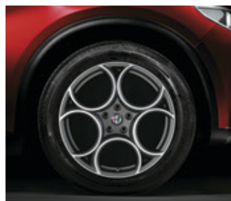
5EV - 19" MILANO SPECIALE