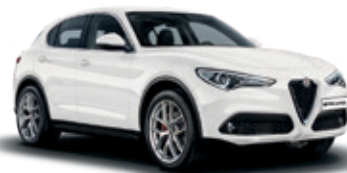
217 לבן אלפא