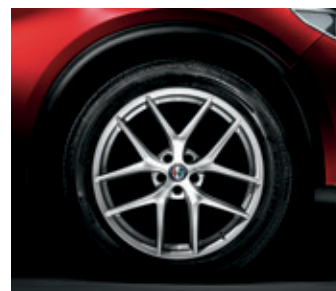
5A6 - 20" FIRST EDITION