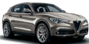
082 בז' טיטניום