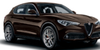
480 חום אטנה