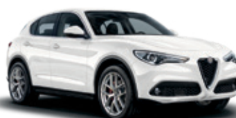
248 לבן טריו