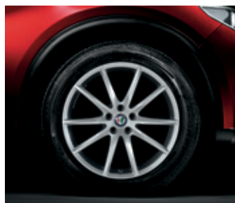
5FB - 19" MILANO SPECIALE