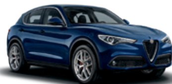
092 כחול מונטה קרלו