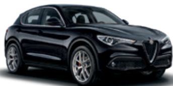
048 שחור וולקנו