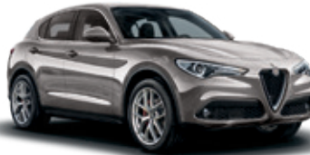
620 כסוף סילברסטון