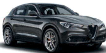
035 אפור מטאליקו