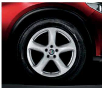
4AY - 18" MILANO