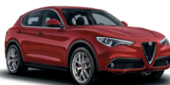
414 אדום אלפא