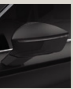
שחור פינינה 6J6J