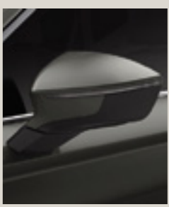
ירוק קמפולאי 9S9S