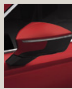
אדום מטאלי 1A1A