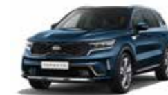
Gravity Blue (B4U)