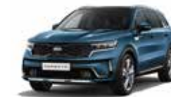
Mineral Blue (M4B)