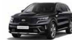
Aurora Black Pearl (ABP)