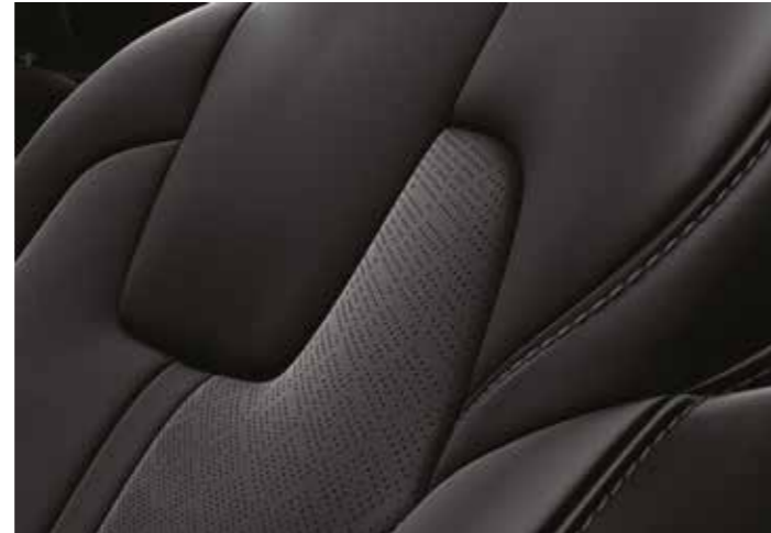
עור שחור בדגם EX/פלאג אין Premium

מושבי הבד השחורים מגיעים עם עיטורים באפקט מתכתי והטבעה תלת ממדית למראה ספורטיבי עוצמתי. בנוסף, תוכלו לבחור במושבי עור בגוון אפור רב רושם או במושבי עור שחורים הכוללים עיטורים בגוון שחור אחיד.