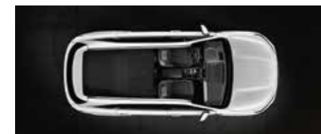
שורה שלישית מקופלת למצב שטוח לגמרי ושורה שנייה מקופלת חלקית