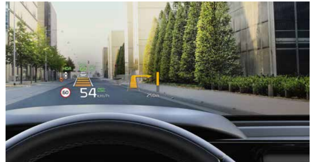
תצוגה עילית HUD* על מנת להבטיח תשומת לב מירבית לכביש, התצוגה העילית מקרינה נתונים כמו מהירות נסיעה והתראות ממערכות הבטיחות ישירות על השמשה הקדמית.