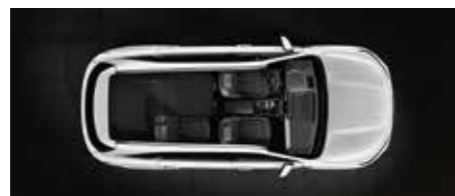
שורה שנייה מקופלת למצב שטוח לגמרי (5 מושבים)