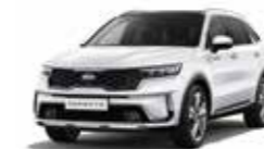
Clear White (UD)