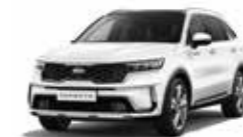
Snow Pearl White (SWP)