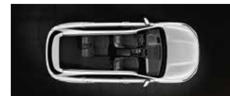
שורה שנייה מקופלת חלקית (5 מושבים)

הסורנטו מוכן היטב לכל משימה שתכננת ולכל מטען שתרכזה לשאת.