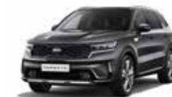
Platinum Graphite (ABT)