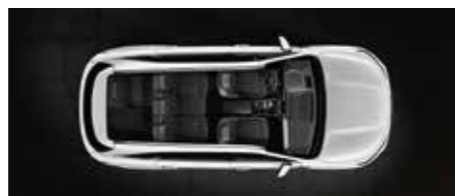
שורה שלישית מקופלת חלקית