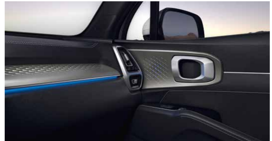
תאורת אווירה ליצירת האווירה המתאימה, הסורנטו החדש מצויד בפסי תאורה עם 7 גוונים לבחירה בדלתות הקדמיות ובחלקו התחתון של הדשבורד.