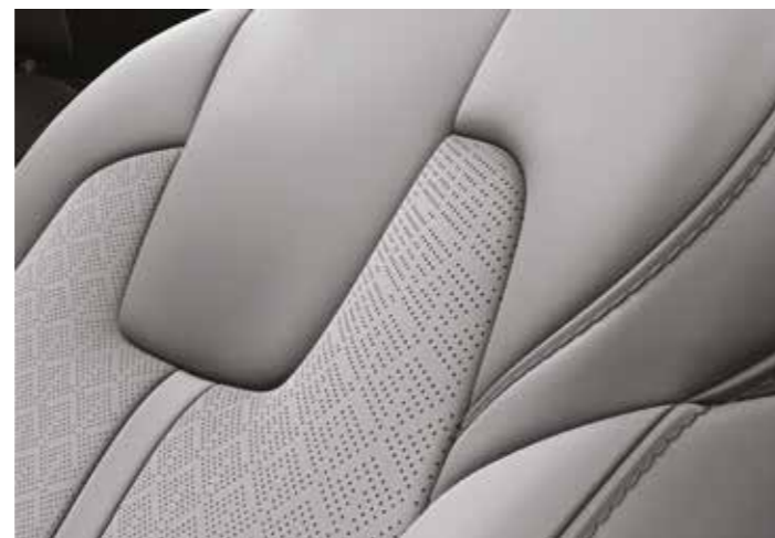
עור אפור בדגם EX/פלאג אין Premium