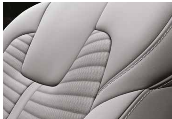
בד אפור לדגמי URBAN בנזין ודיזל