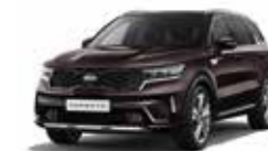
Essence Brown (BE2)