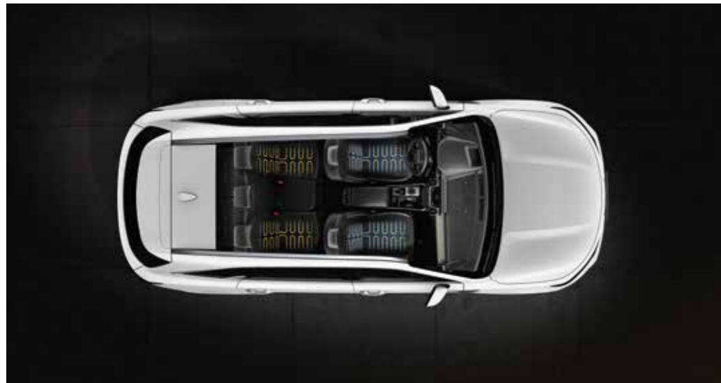
מושבים קדמיים עם חימום ואוורור* לימים חמים, מושב הנהג והנוסע כוללים חרירי אוורור בבסיס המושב ובמשענת הגב. לימים קרים, ניתן לחמם את הבסיס ומשענת הגב של המושב

חלוק את חוויית הנסיעה שלך יחד עם האנשים שאתה אוהב. הסורנטו החדש מעניק חוויה ייחודית לנהג ולשאר הנוסעים ברכב, הודות לתא הנוסעים המרווח, הנוח ובעל העיצוב הארגונומי.