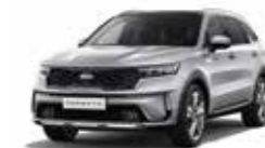
Silky Silver (4SS)