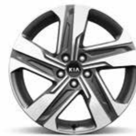
חישוקי 19 אינץ' בדגמי הייבריד EX ופלאג אין PREMIUM

חישוקי סגסוגת הסורנטו זמין עם חישוקי סגסוגת אווירודינמיים וקלי משקל בקוטר 18 או 19 אינץ' המדגישים את אופיו השרירי והקשוח