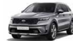
Steel Grey (KLG)