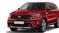
Runway Red (CR5)