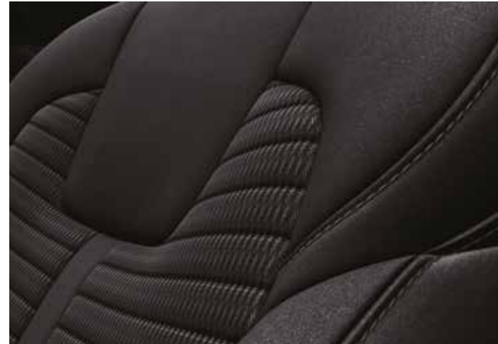
בד שחור בדגם היברידי EX/בנזין+דיזל URBAN