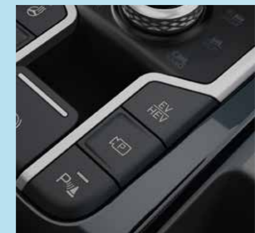
Smartstream G1.6 T-GDi HEV

כפתור EV/HEV הממוקם בקונסולה המרכזית מאפשר בחירה בין מצב חשמלי למצב היברידי. במצב EV (חשמלי) האידיאלי לנסיעה עירונית, הסורנטו פלאג אין מתעדף שימוש במנוע החשמלי בלבד לנסיעה נטולת זיהום וצריכת דלק לחלוטין. במצב HEV (היברידי) האידיאלי לנסיעות בייעורניות ארוכות, יופעלו גם מנוע הבנזין וגם המנוע החשמלי ביחד באופן חלק כדי לספק את מלוא הביצועים הנדרשים.