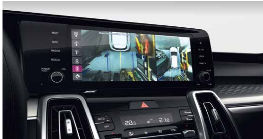
מצלמות היקפיות 360* מערכת המשלבת 4 מצלמות בעלות עדשה עם זווית רחבה הממוקמות בחלקו הקדמי, האחורי ומצדדי הרכב, ויוצרות "מבט על" על הסביבה של הסורנטו לסיוע בתמרוני חניה.