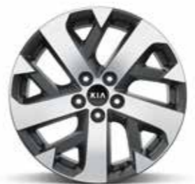
חישוקי 18 אינץ' בדגמי URBAN/EX בנזין ודיזל