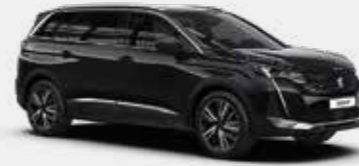
שחור מטאלי BLACK PERLA | 9VM0