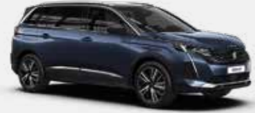
כחול בהיר מטאלי CELEBES BLUE | SYMO