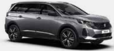
כסוף כהה מטאלי ARTENSE GREY | F4M0

לרשותך עומד מגוון רחב של צבעים שיאפשר לך להביע את עצמך באופן מלא.