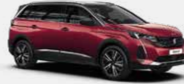
אדום מטאלי ULTIMATE RED | F3M5

*צבע מטאלי בתוספת תשלום (למעט כחול בהיר)