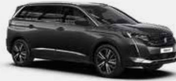
אפור כהה מטאלי PLATINIUM GREY | VLMO