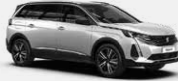
לבן פנינה מטאלי PEARLESCENT WHITE | N9M6