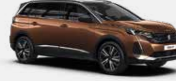
חום מטאלי METALLIC COPPER | LGM0