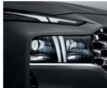
תאורה ראשית מסוג LED