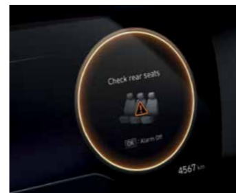
מערכת אקטיבית המתריעה על שיכחת ילד/ נוסע במושב האחורי (ROA)