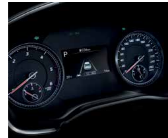
מחשב דרך צבעוני 4.2"