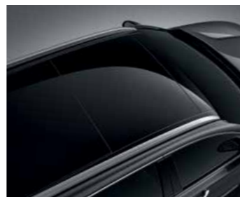
גג שמש פנורמי נפתח