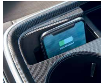
טעינה אלחוטית לנייד בתקן Qi**