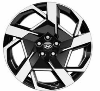
חישוקי סגסוגת 20" בדגם Elite