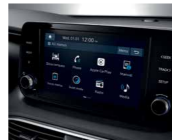
מערכת מולטימדיה מקורית עם מסך 8"