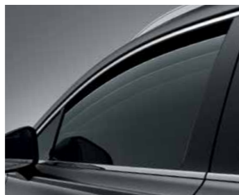
חלונות חשמל חכמים