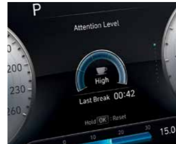
סייען לעירנות נהג (DAW)