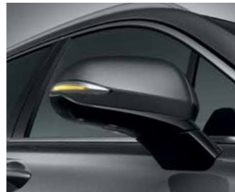
פנסי איתות במראות