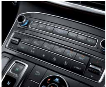
מערכת בקרת אקלים מפוצלת