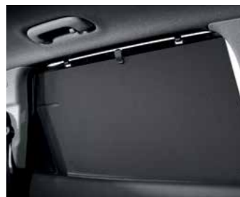
וילון צד במושב האחורי