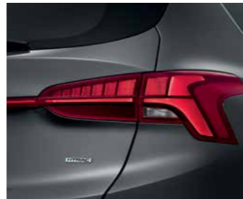
פנסי LED אחוריים*