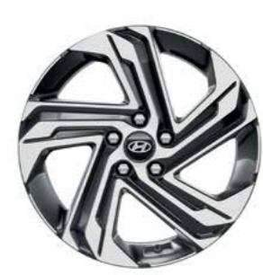
חישוקי סגסוגת 18" בדגם Supreme