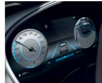
SVC - לוח שעונים דיגיטלי מלא 12.3**