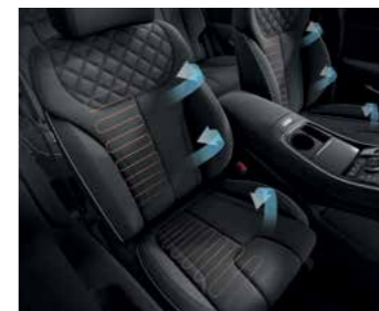
חימום+אורור מושבים קדמיים*