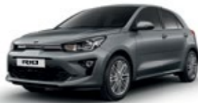
Perennial Grey [PRG]