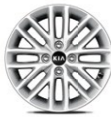
חישוקי סגסוגת קלה 15"