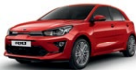
Signal Red [BEG]