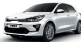
Clear White [UD]