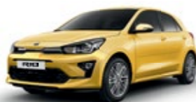
Most Yellow [MYW]