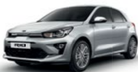
Silky Silver [4SS]