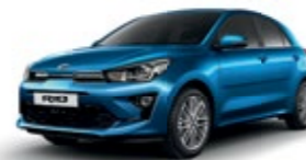
Sporty Blue [SPB]