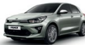
Urban Green [URG]