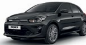
Aurora Black Pearl [ABP]