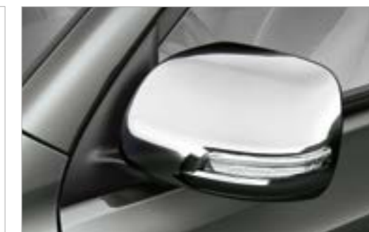
ניסוי ניקל למראות