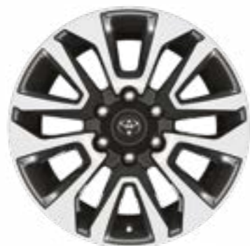
סגסוגת קלה 19" לדגמים LIMITED, SAHARA