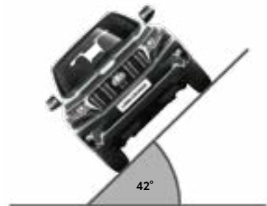
שיפוע צד מרבי