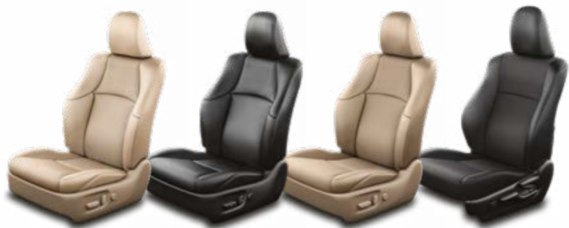
דגמים: LUXURY LIMITED, SAHARA ריפוד עור בצבע בז' ברכבים בכל הצבעים החיצוניים מלבד לבן פנינה