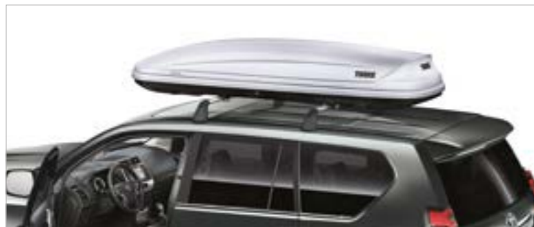
ארגז אחסון עליון THULE (בהתקנת מוטות רוחב)