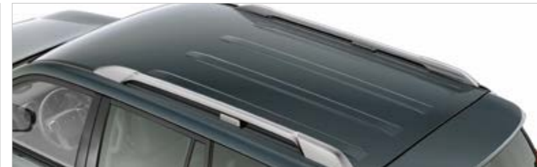
מוטות אורך (לדגם הארוך בלבד)