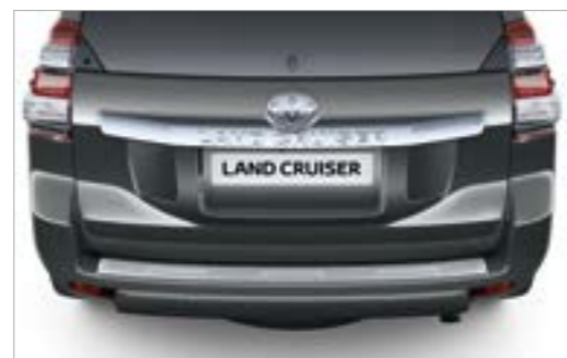
מגן שריטות תחתון