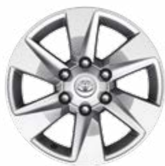
סגסוגת קלה 17" לדגמים TS7, SELECT ו-LUXURY