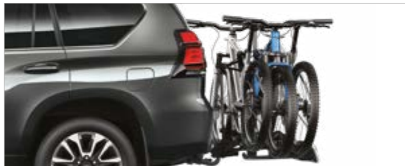
מתקן ל-3 זוגות אופניים (בהתקנת וו גרירה)