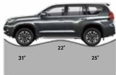
דגם ארוך זווית נטישה/גחון/גישה