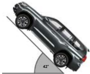
זווית טיפוס מרבית