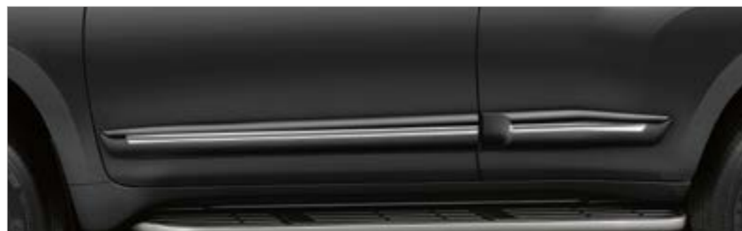
פס הגנה לדלתות עם ניקל (לדגם הארוך בלבד)