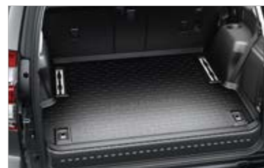
אמבטיה לתא המטען