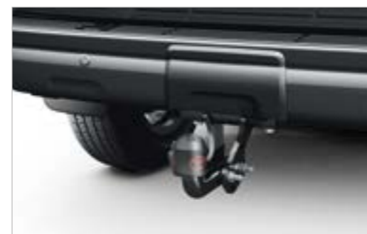
וו גרירה נשלף/קבוע