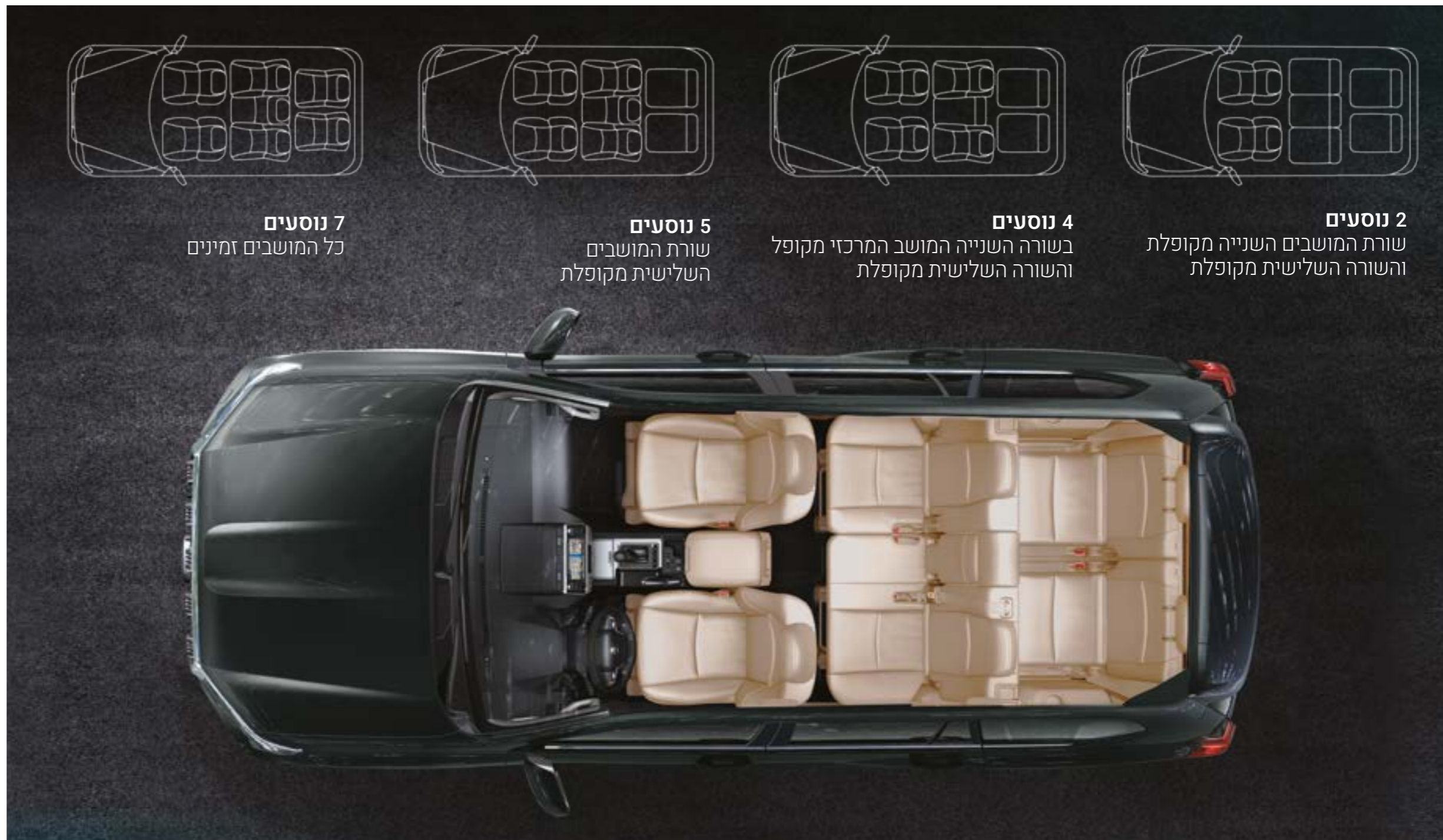
7 נוסעים כל המושבים זמינים