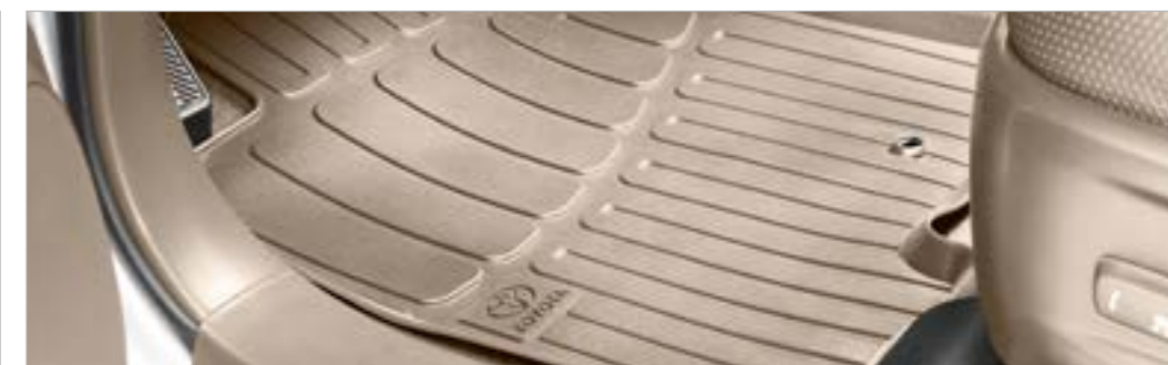
סט שטיחי גומי בצבע בז' (בנוסף לשטיחי לבד המקוריים המסופקים עם הרכב)