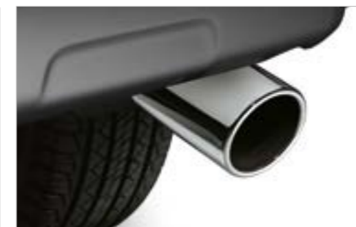
קצה אגוז ניקל