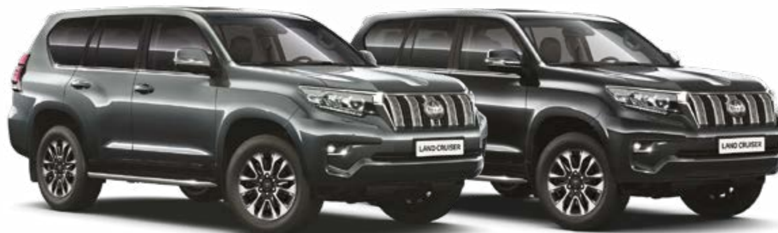
אפור כהה מטאלי 163