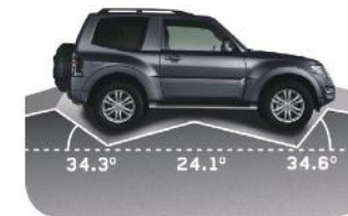
זווית מרכב (דגם קצר)