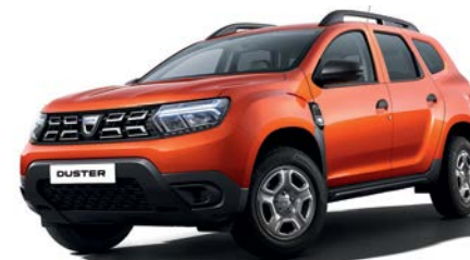
כתום אריזונה מטאלי