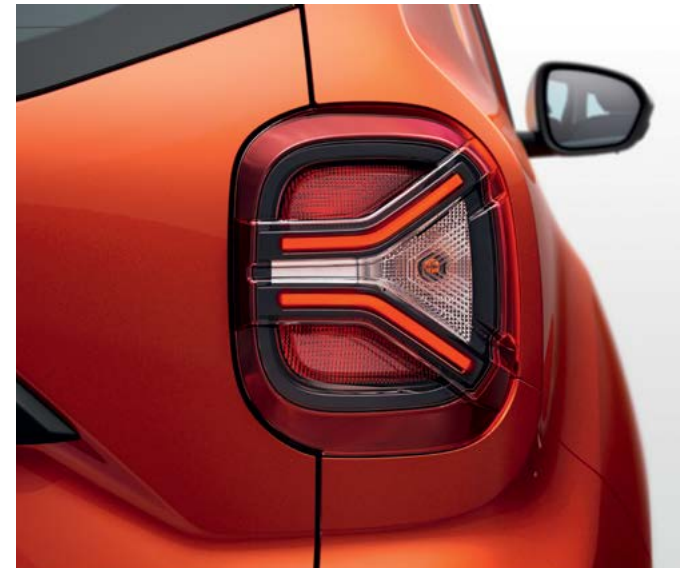
פנסים אחוריים בצורת Y