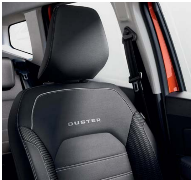
ריפודים ומשענות ראש חדשים ונוחים

רבים מכם חיכו לזה - הדאסטר החדש עם תיבת ההילוכים האוטומטית הגיע והופך את הנהיגה למהנה עוד יותר. מסך המגע בגודל 8 אינץ' במערכת המולטימדיה מקל על השימוש וקריאת המידע. הריפוד בעל המראה החדש, משענות הראש הקדמיות ומשענת היד המרכזית גורמים לחוויית נהיגה נוחה יותר.