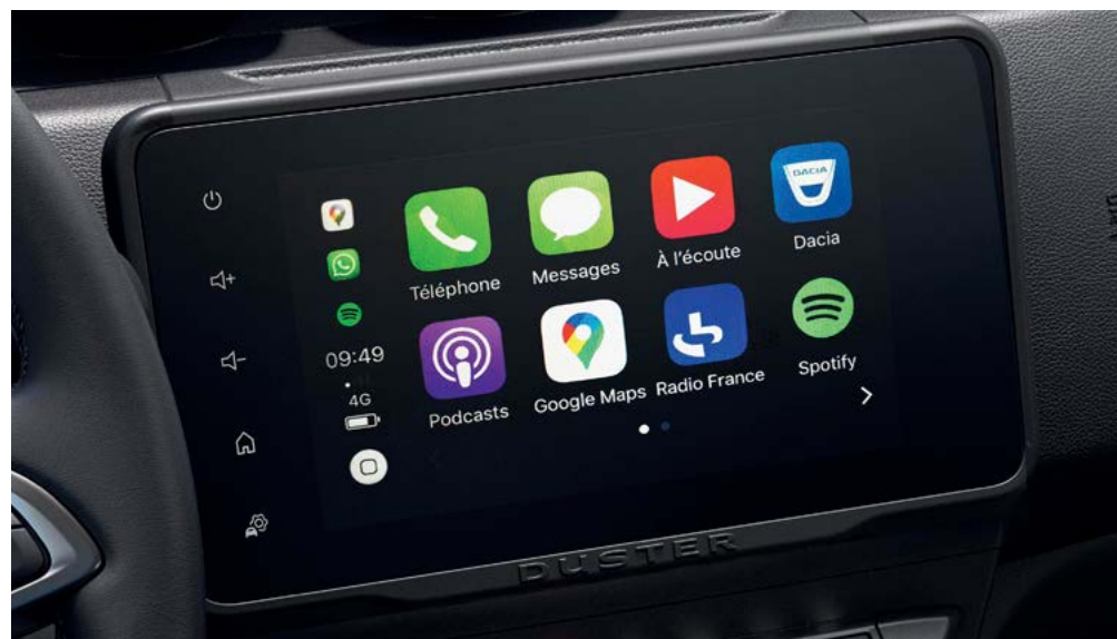
תצוגת הסמארטפון על גבי מסך מגע 8" בעזרת APPLE CARPLAY™ או ANDROID AUTO™