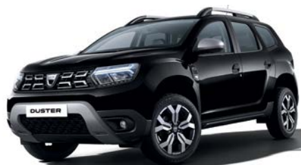
שחור פנינה מטאלי