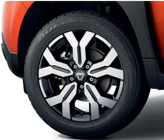
חישוקי סגסוגת 17"

הספילר המחודש עוזר להפחית את פליטת הפחמן הדו חמצני וחישוקי האלומיניום החדשים מוסיפים להופעה הייחודית של הדאסטר. יש גם צבע כתום חדש שעושה חשק לעלות לכביש.