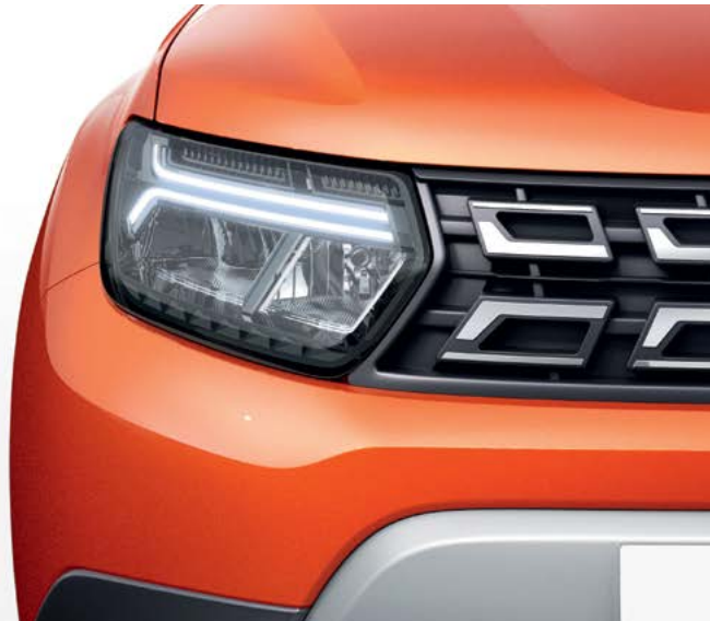
חזית רכב בעיצוב חדש