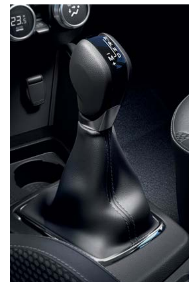
תיבת הילוכית אוטומטית