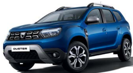
כחול בהיר מטאלי