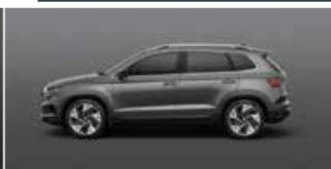
GRAPHITE GREY (5X)