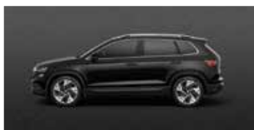
MAGIC BLACK (1Z)