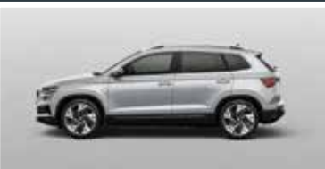
BRILLIANT SILVER (8E)