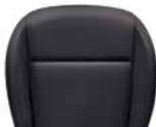
ריפודי בד - שחור