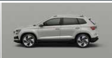
STEEL GREY (M3)