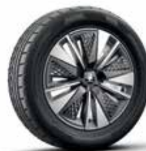
חישוקי מגנזיום PROCYON "18"