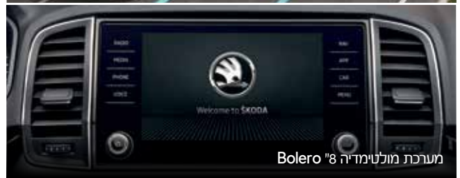
מערכת מולטימדיה "8 Bolero