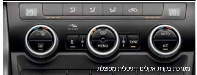
מערכת בקרת אקלים דיגיטלית מפוצלת