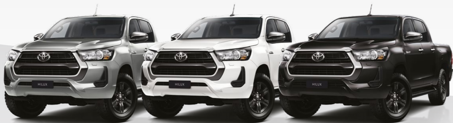
כסוף מטאלי 1D6