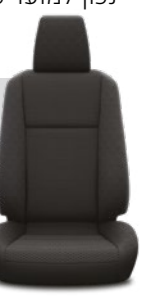
ריפודי בד בצבע שחור דגמי ACTIVE