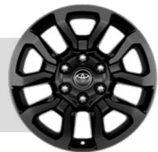
חישוקי סגסוגת קלה 18" בצבע שחור דגם SAHARA

*מומלץ לבדוק את תאימות הטלפון הנייד שברשותך למערכת ה-Bluetooth המותקנת ב-טוואו, אשר הינה מסוג: Toyota Touch 2. ● קיים ○ לא קיים את הבדיקה ניתן לעשות בלינק הבא: www.toyota-tech.eu/bluetooth/search.aspx **נכון למועד פרסום קטלוג זה, אפליקציית Android Auto אינה זמינה בישראל.