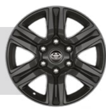
חישוקי סגסוגת קלה 17" בצבע שחור דגמי ACTIVE+, ADVENTURE