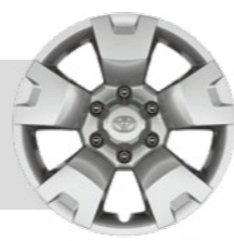
צלחות כיסוי מהודרות לחישוקי פלדה 17" דגמי ACTIVE