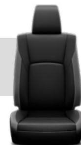
ריפודי עור מהודר בצבע שחור דגם SAHARA