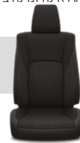
ריפודי בד מהודרים בצבע שחור דגמי ACTIVE+, ADVENTURE