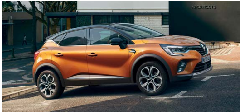
1.33 ל' טורבו בנזין אוט' LIGHT HYBRID EXECUTIVE