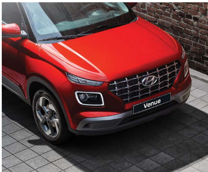
חזית במראה אגרסיבי עם גריל מעוצב*