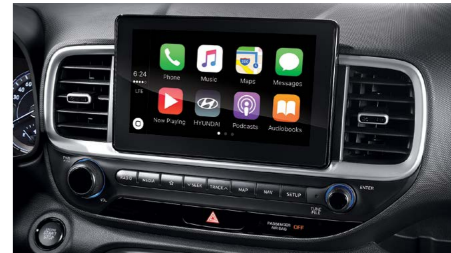
מערכת מולטימדיה מקורית 8" עם אפשרות חיבור למערכת *Android Auto, Apple Carplay