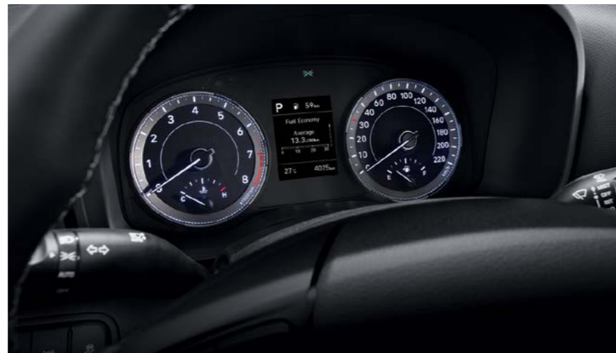
לוח מחוונים דיגיטלי 3.5"