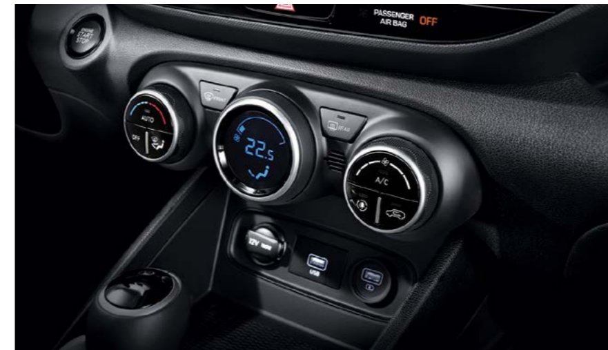
מערכת בקרת אקלים דיגיטלית**