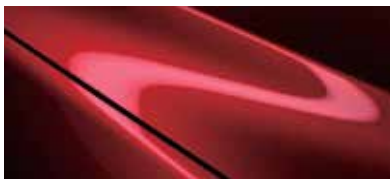
אדום עשיר נוצץ (46V)*