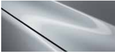
כסף סוניק (45P)