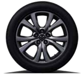
סגסוגת קלה 18" בגימור ייחודי ברמת גימור Premium

לתשומת ליבך! - נתוני צריכת הדלק הם לפי בדיקות המעבדה. צריכת הדלק בפועל עשויה להשתנות בהתאם לתנאי הדרך, האקלים, תחזוקת הרכב ומאפייני הנהיגה ויכולה להיות גבוהה מנתוני היצרן. - המידע בעלון זה הינו בינלאומי ומציג נתונים עדכניים למועד הפקתו ושאינם תואמים בהכרח את המכונות המיובאות בפועל לישראל. חברת מאזדה ודלק מוטורס בע"מ שומרות לעצמן את הזכות להכניס שינויים במפרט הטכני, באביזרי המכונות ובעלון זה מכל סיבה שהיא, בכל עת וללא הודעה מוקדמת. פנה לנציג המכירות לקבלת מידע.