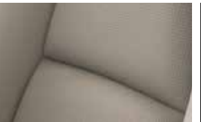
ריפוד עור שחור / לבן ברמת גימור Executive Comfort