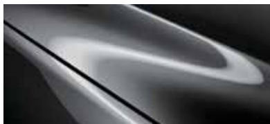
אפור עשיר (46G)*