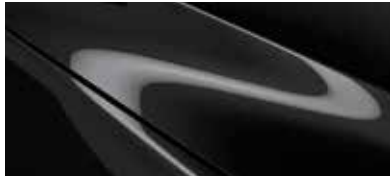
שחור סילון (41W)