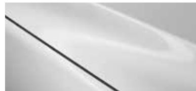
לבן פנינה (25D)