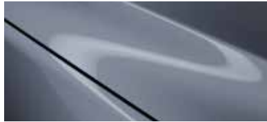
כחול מתכתי (47C)