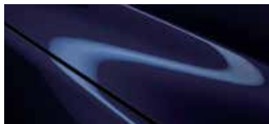
כחול קריסטל כהה (42M)