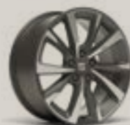
חישוק לאון FR מנוע 1.5