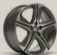
חישוק לאון FR מנוע 2.0