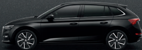
MAGIC BLACK METALLIC