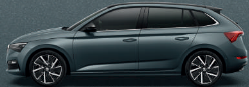
QUARTZ GREY METALLIC