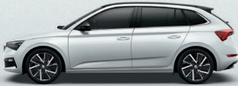
MOON WHITE METALLIC