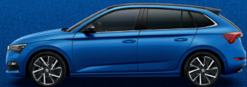
RACE BLUE METALLIC

* ייתכן הבדל בין גוון הצבע הנראה במפרט לבין הגוון בפועל