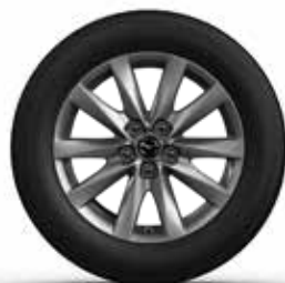
חישוק 17" סגסוגת קלה ברמת גימור Luxury