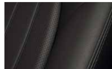
עור נאפה מהודר לבן / חום, בשילוב גימור כרום ייחודי ברמת גימור Signature