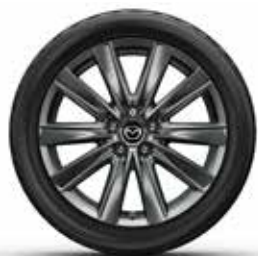
חישוק 19" סגסוגת קלה בגוון כהה ברמת גימור Signature