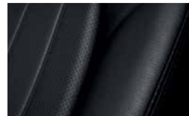
עור לבן / שחור ברמת גימור Luxury