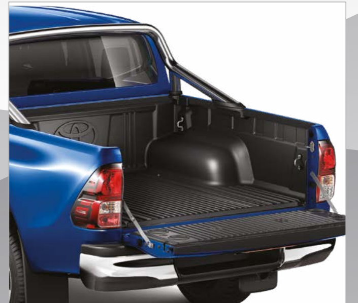
משטח הגנה קשיח מפלסטיק לארגז כולל כיסוי דפנות ודלת ארגז