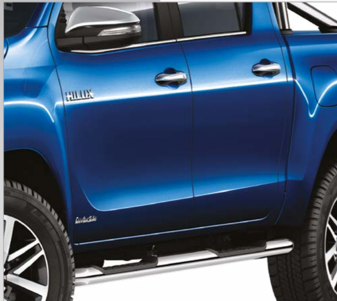
מדרגות צד מהודרות מפלדת אל חלד