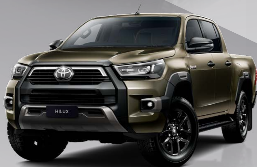
ברונזה מוזהב מטאלי 163*