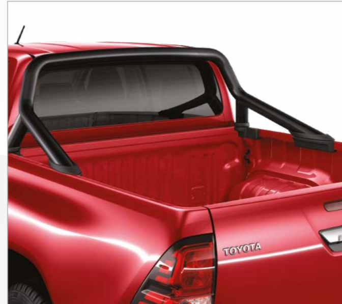
קשת הגנה דקורטיבית לארגז בצבע שחור