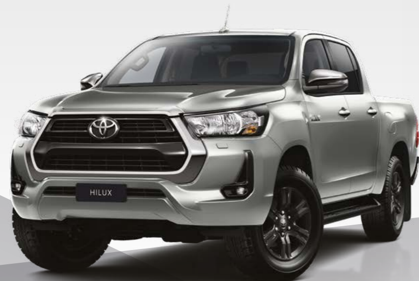
כסוף מטאלי 106