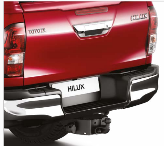
וו גרירה קבוע