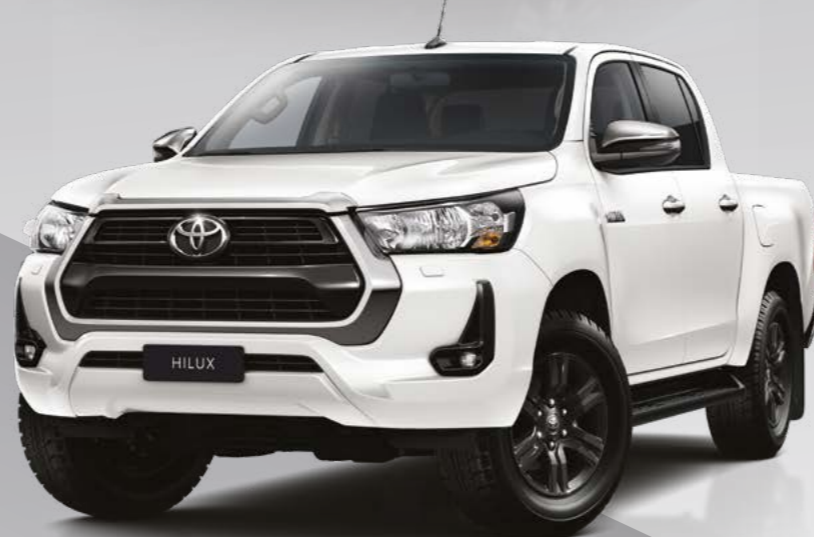
לבן פנינה מטאלי 070