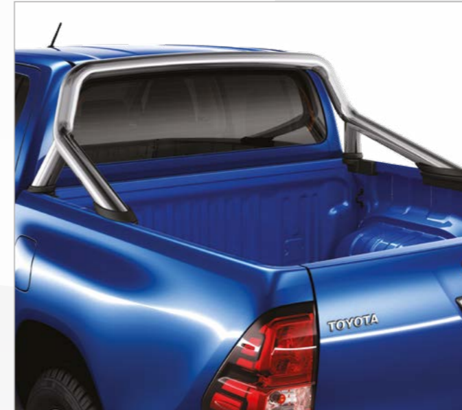
קשת הגנה דקורטיבית לארגז בצבע ניקל