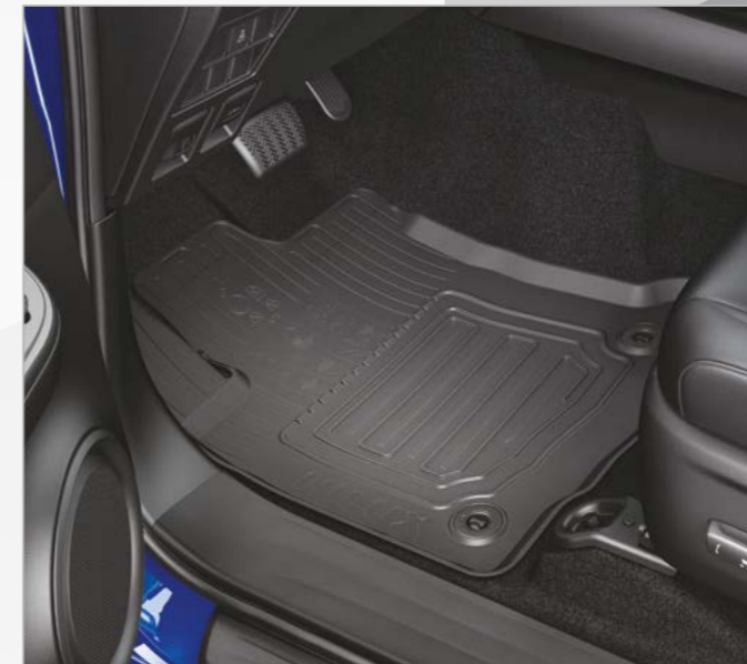
ט 4 שטיחי גומי בצבע שחור