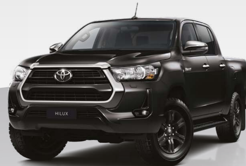
שחור מיקה מטאלי 218