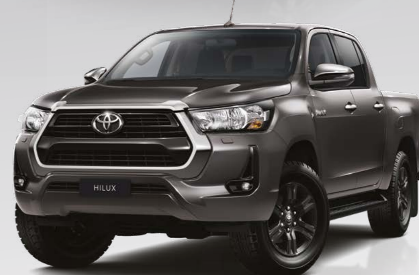
אפור כהה מטאלי 163