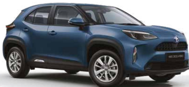
כחול אורבני 8W2