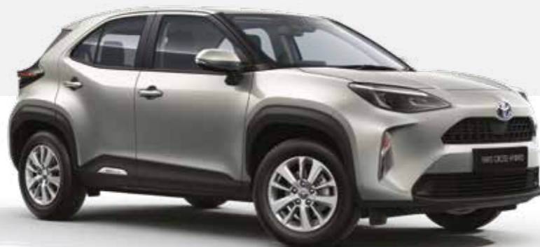
כסוף יוקרתי מטאלי 1L0