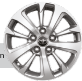
חישוקי סגסוגת קלה 16"