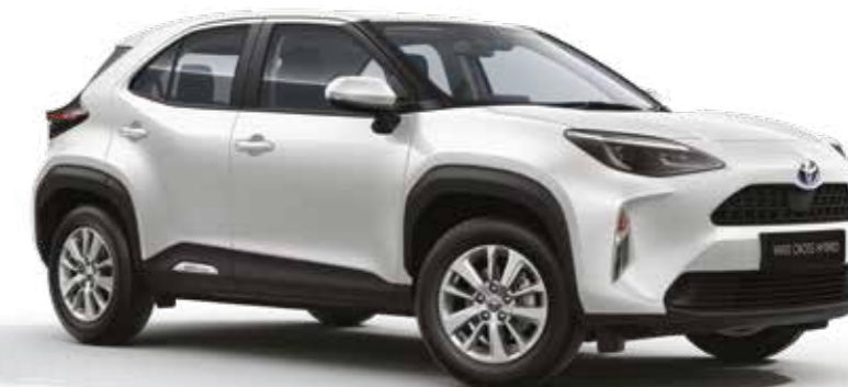
לבן צחור 040