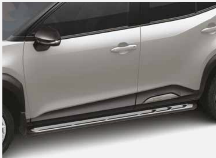
מדרגות צד המעצימות את המראה המחוספס של הרכב. שבנוסף מסייעות להגיע לגג הרכב בצורה קלה ופשוטה יותר