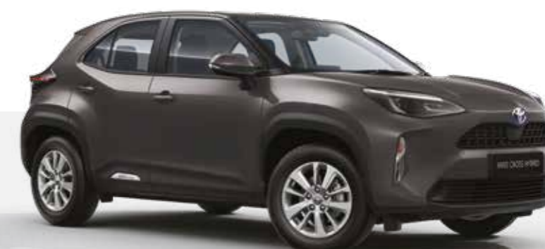
אפור כהה מטאלי 1G3