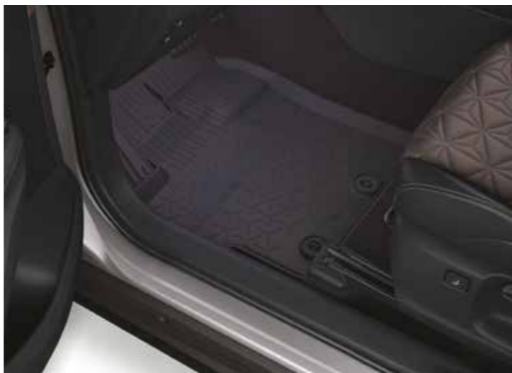
שטיחי גומי המגנים על פנים הרכב מפני לכלוך מבחוץ וניתנים להסרה לניקוי קל ופשוט