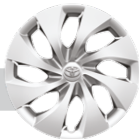
חישוקי פלדה 16"