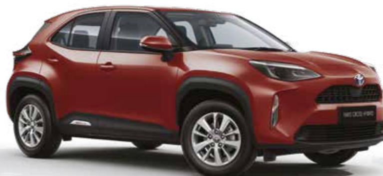
אדום מטאלי 3U5