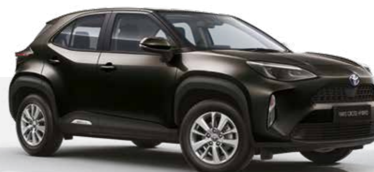
שחור מטאלי 209