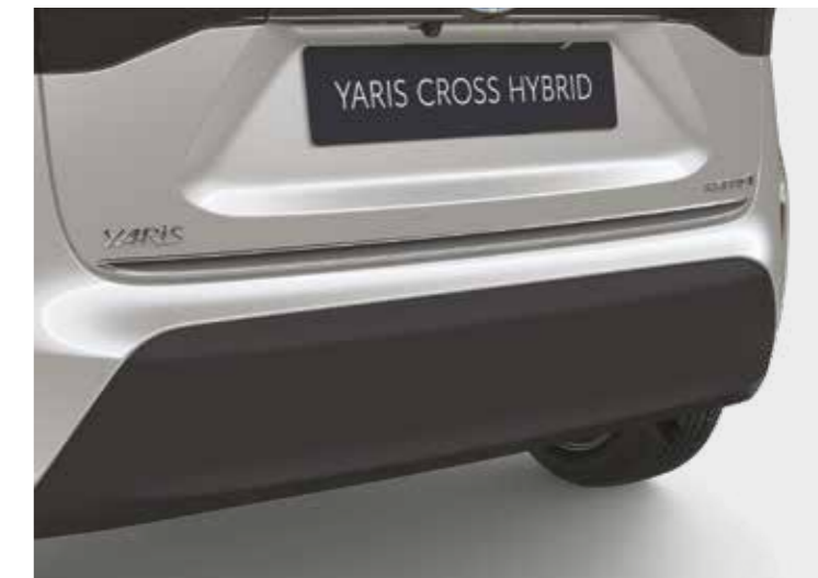
הוסיפו קישוט כרום המדגיש את עיצוב הפגוש האחורי ומבליט את המראה הייחודי של הרכב