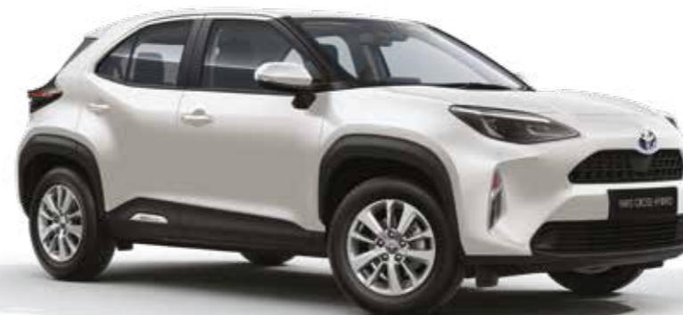
לבן פנינה מטאלי 089