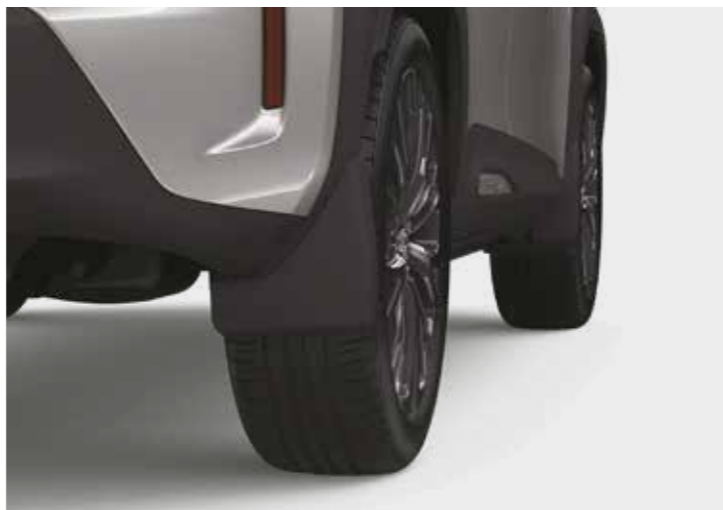
סט מגיני בוץ קדמיים ואחוריים, שיעזרו למזער כתמי מים ובוץ על הרכב