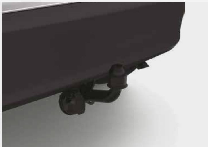
וו גרירה קבוע*