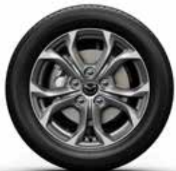
חישוקי סגסוגת 16"

* פונקציית הניווט המקורי של היצרן במערכת המולטימדיה שברכב זה איננה פעילה. במידה וברצונכם להפעילה, ניתן לרכוש כרטיס מסוג SD הכולל מפות. נא פנה לנציג המכירות לקבלת פרטים נוספים. לידיעתך - הניווט באמצעות יישומון WAZE אפשרי באמצעות מערכת אפל קארפליי ואנדרואיד אוטו בכפוף לאמור במפרט זה לעיל ** באמצעות טלפון נייד התומך ומאפשר זאת ובכפוף למגבלות שונות