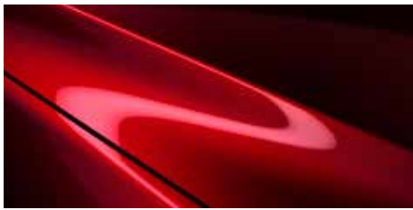
אדום עשיר נוצץ (46V)*