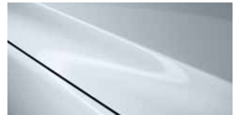
לבן קרמי (47A)