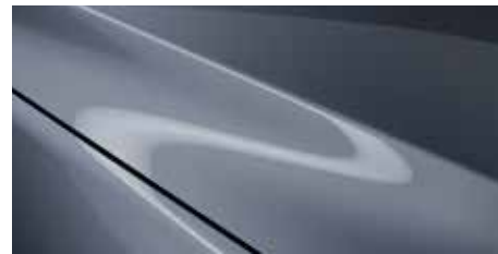
כחול מתכתי (47C)