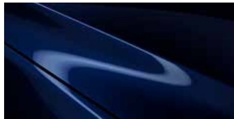
כחול קריסטל כהה (42M)