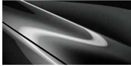
אפור עשיר (46G)*