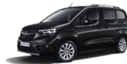
Onyx Black (G7R) שחור מטאלי*