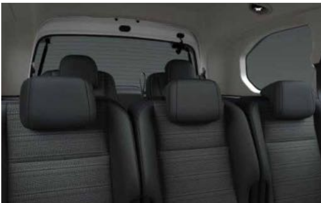
ריפוד בד בצבע אפור משולב עם שחור