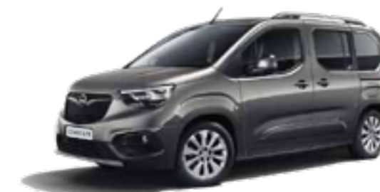
Moonstone Grey (G4O) אפור כהה מטאלי*