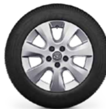
חישוקי סגסוגת 16" לדגמי ELEGANCE 7 מושבים