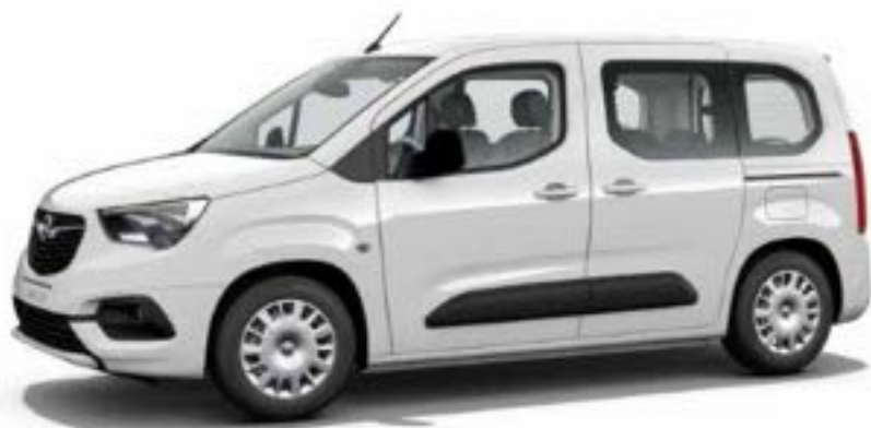
רמת גימור 5 – ENJOY/ENJOY PLUS מושבים