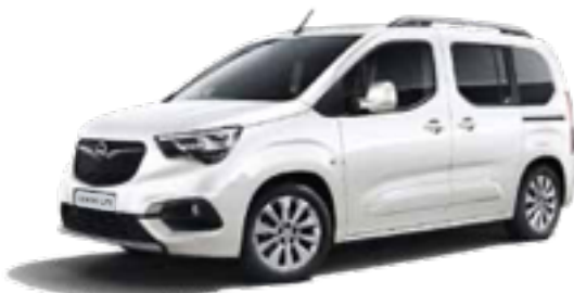
White Jade (G2O) לבן