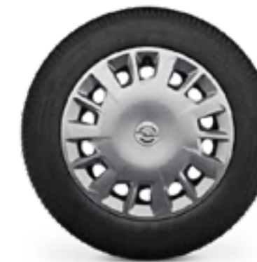
חישוקי פלדה 16" לדגמי ENJOY/ENJOY PLUS 5 מושבים