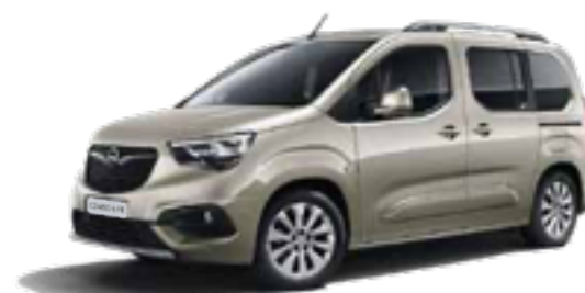
Cool Grey (GAC) בז' מטאלי*