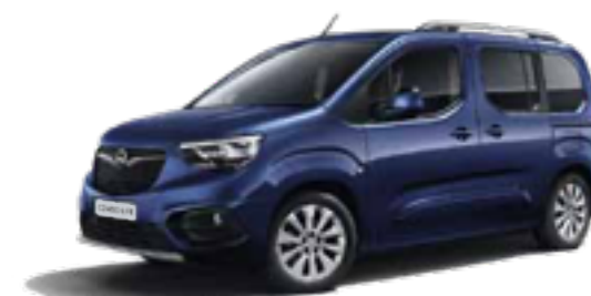
Night Blue (GBT) כחול מטאלי*