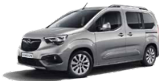
Quartz Grey (G4I) כסף מטאלי*