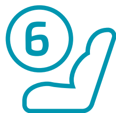
6 כריות אוויר - ההגנה כוללת כריות אוויר קדמיות לנהג ולנוסע הקדמי, שתי כריות אוויר צדיות ושתי כריות וילון הנפרשות לכל אורך תא הנוסעים