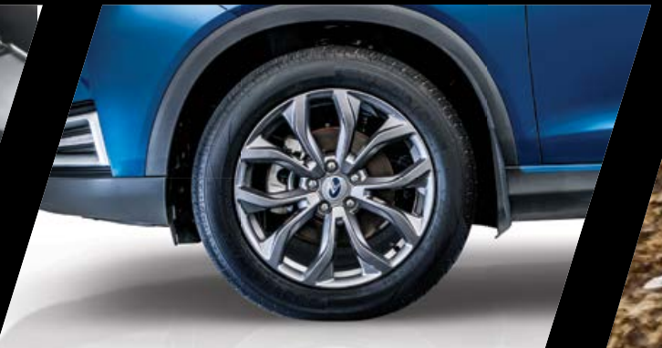
חישוקי אלומיניום בגודל 18"