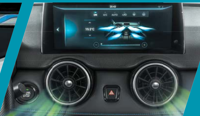
מערכת בקרת אקלים ופתחי מיזוג למושבים אחוריים