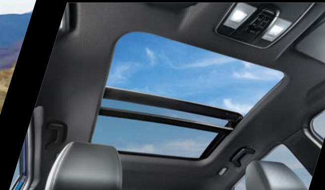
חלון גג פנורמי נפתח עם וילון חשמלי