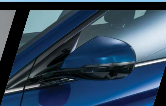
מראות צד מתקפלות חשמלית