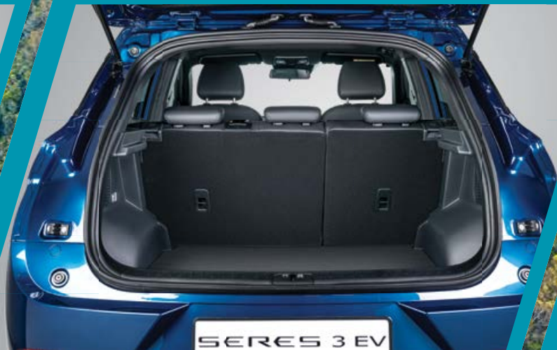
גמישות פנימית החלל הפנימי של SERES 3 גמיש מספיק כדי לתמוך בסגנון חיים פעיל ודינאמי. מושב אחורי מפוצל ומתקפל ביחס 60:40