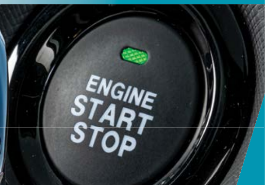
"מפתח חכם" לכניסה והנעה ללא מפתח