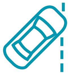
LDWS - מערכת התראה סטייה מנתיב