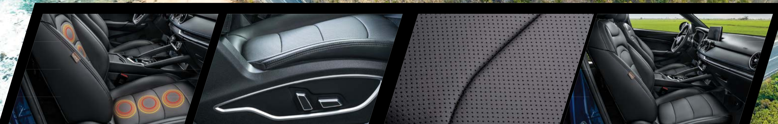
מושבים קידמיים עם כוונן חשמלי וחימום

הודות למידות הפנים הנדיבות, גם לך וגם לנוסעים מובטחת נסיעה נינוחה, שפע של מקום ודרכים חכמות לנצל אותו. המושב האחורי רב-תכליתי מתקפל ביחס של 60:40 וגם למצב שטוח, ומאפשר להגדיל את מרחב האחסון העומד לרשותך.