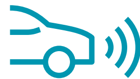
FCW - מערכת התראה למניעת התנגשות קדמית