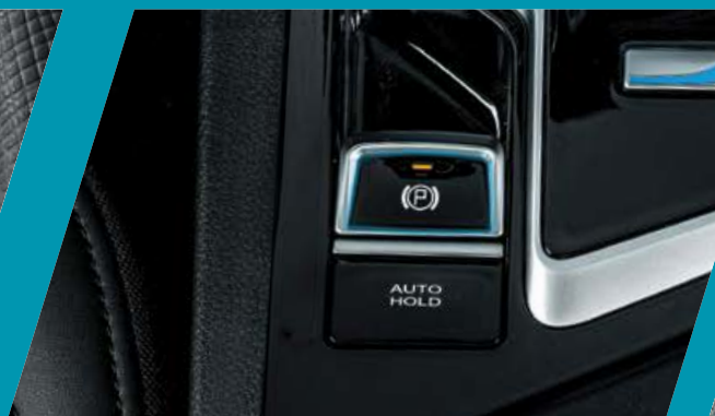
בלם חניה חשמלי