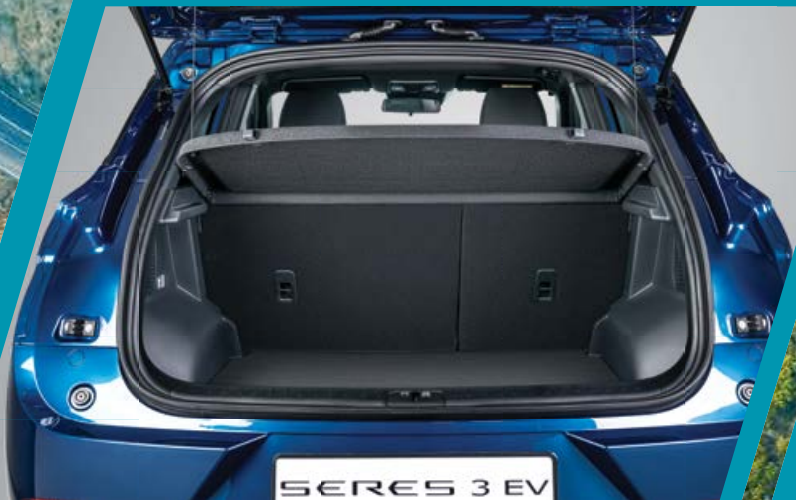
כיסוי לאזור המטען