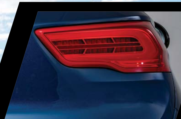
יחידת תאורה אחורית LED