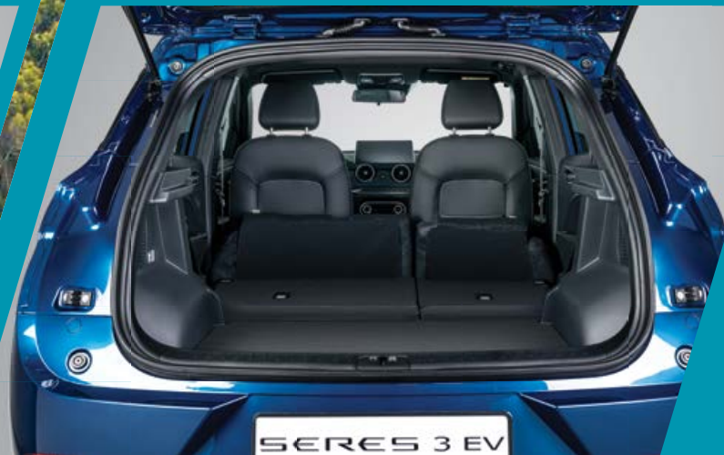
מושב אחורי מתקפל גב המושב האחורי מתקפל למצב שטוח לקבלת נפח מטען וגמישות מרביים.

הודות למידות הפנים הנדיבות, גם לך וגם לנוסעים מובטחת נסיעה נינוחה, שפע של מקום ודרכים חכמות לנצל אותו. המושב האחורי רב-תכליתי מתקפל ביחס של 60:40 וגם למצב שטוח, ומאפשר להגדיל את מרחב האחסון העומד לרשותך.