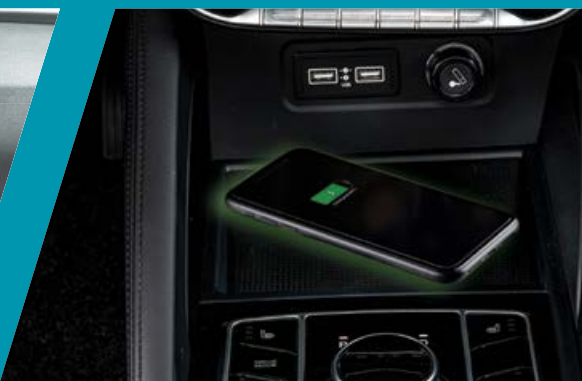
משטח טעינה אלחוטי לטלפון