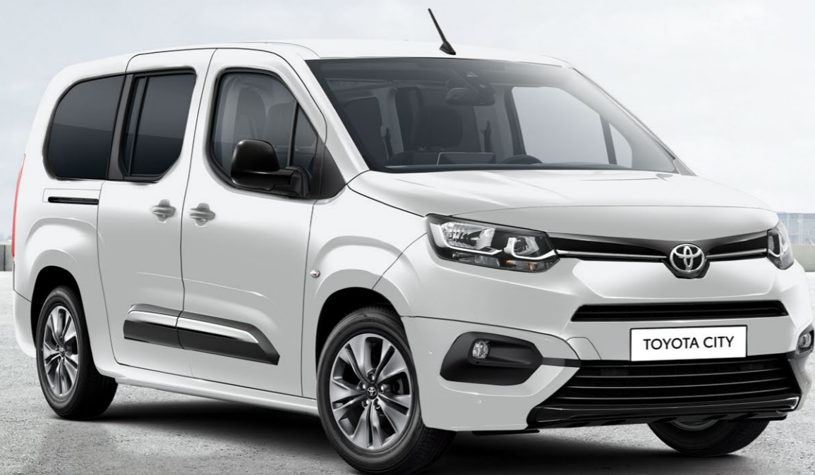
TOYOTA CITY 7

הכירו את הדגמים המסחריים שלנו הנותנים מענה לכל עסק