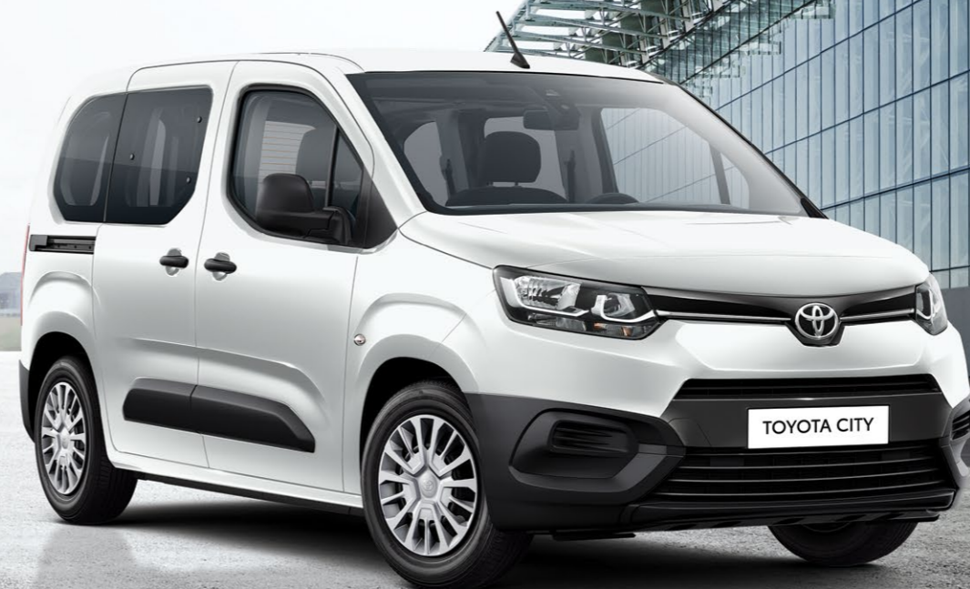
TOYOTA CITY 5