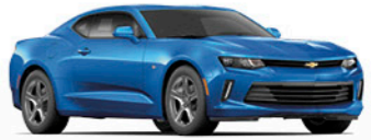
כחול טרופי מטאלי (GD1)*