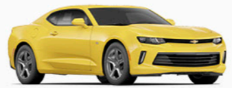
צהוב בוהק (G7D)*