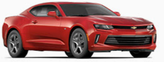
אדום קריסטל מטאלי (G7E)*