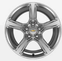
חישוקי "18" (REG)