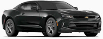
שחור כוכב מטאלי (G8B)*