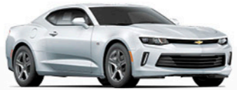
כסף מטאלי (GAN)