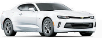
לבן פסגה (GAZ)