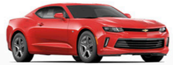
אדום לוחט (G7C)