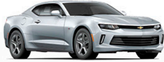
כסף ירח מטאלי (GGB)