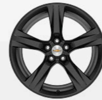
חישוקי "20" (RTH)