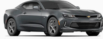
אפור כהה מטאלי (G7Q)