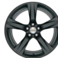
חישוקי 20" (RTH)