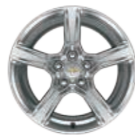
חישוקי 18" (REG)