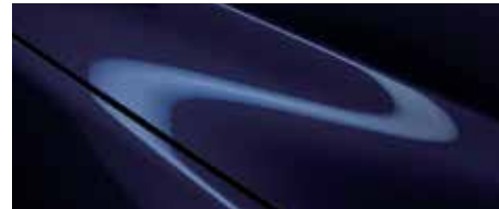
כחול קריסטל כהה (42M)