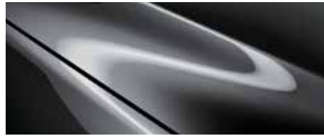
אפור עשיר (46G)*