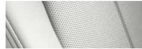
ריפוד עור Nappa לבן במהדורת Special Edition