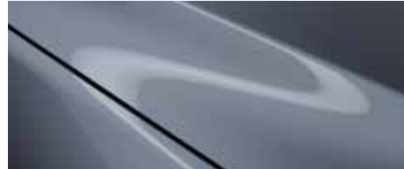
כחול מתכתי (47C)