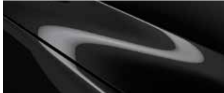
שחור סילון (41W)