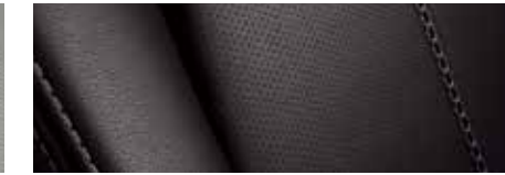
ריפוד עור שחור