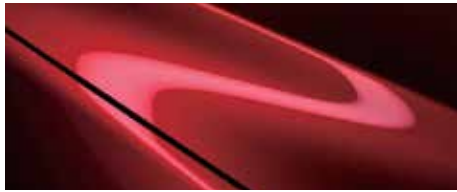
אדום עשיר נוצץ (46V)*