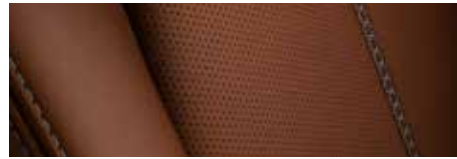
ריפוד עור Nappa חום במהדורת Special Edition