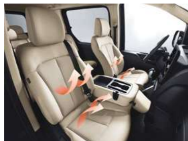
חימום מושבים קדמיים*