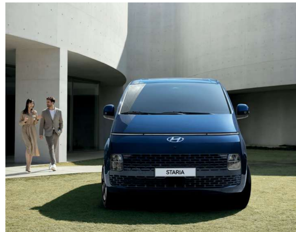
פנסים קדמיים מסוג LED*

כבר מהמבט ראשון, ברור שיונדאי STARIA היא יצירה מקורית אמיתית. החוץ, הוא עיצוב מעורר השראה עם העיניים קדימה. בפנים, ממתין לכם תא נוסעים עצום, פתוח ורחב, עם חומרים אלגנטיים רכים ונעימים למגע וסביבת נהג עשירה במאפיינים יוקרתיים כגון לוח מחוונים דיגיטלי*.