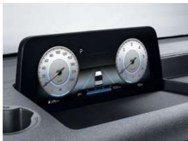
לוח מחוונים דיגיטלי 10.25*