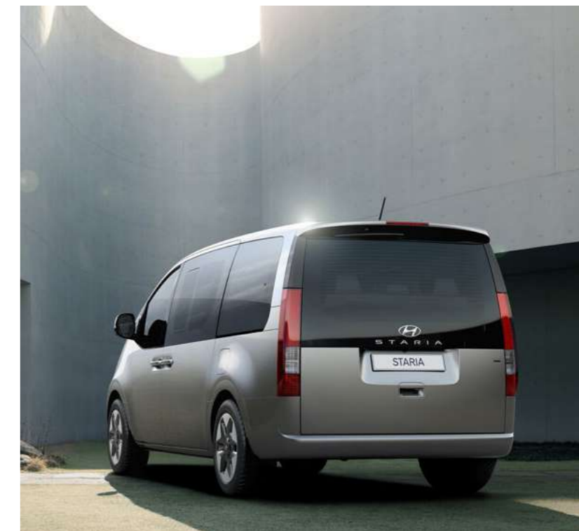
פנסים אחוריים מסוג LED עם פיקסלים משתנים*