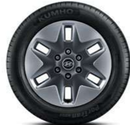
חישוקי סגסוגת 18" (דגם Luxury בלבד)