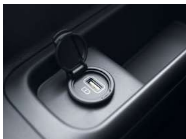
שקעי USB בכל המושבים*