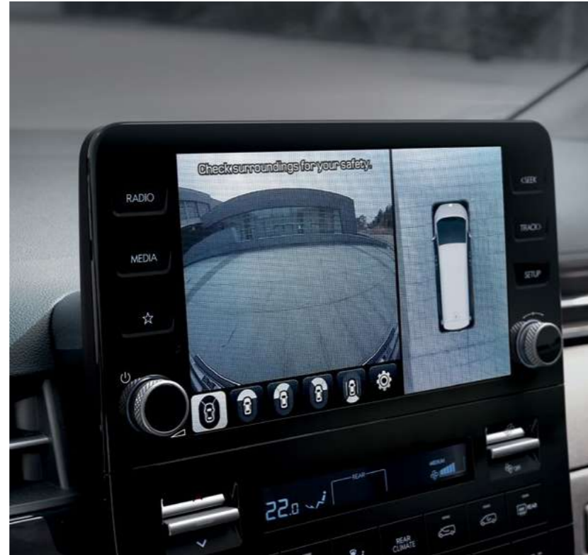
מערך מצלמות היקפיות (AVM)* יונדאי סטאריה מצוידת במערך 4 מצלמות היקפיות המאפשר זווית עין בכל זמן, של כלל סביבת המכונית.