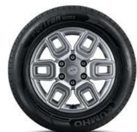
חישוקי סגסוגת 17" (דגם Premium בלבד)