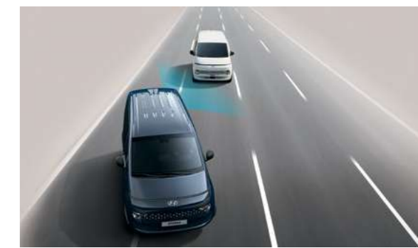
מערכת אקטיבית לזיהוי ומניעת התנגשות בכלי רכב ב"שטח מת" (BSA) מערכת אקטיבית למניעת התנגשות בעת מעבר נתיב המספקת התרעה על רכב ב"שטח מת".