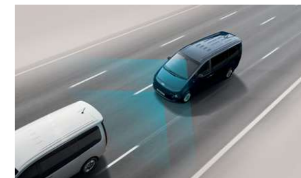
בלימה אוטונומית במצבי חירום (FCA) מערכת בלימה אוטונומית במצבי חירום הכוללת זיהוי הולך רגל, כלי רכב ודו-גלגלי.