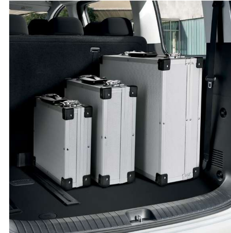
תא מטען מרווח תא המטען בנפח של עד 1,303 ל' (בהזזת המושבים קדימה) יאפשר לכם להכניס בנוחות את כל הציוד הנדרש לכם, למשפחה, ולכלל הנוסעים.