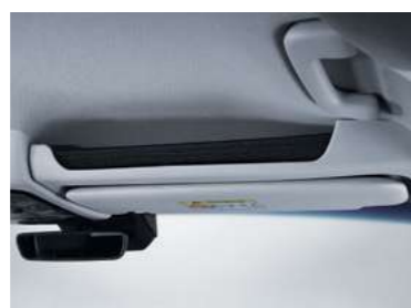
תא אחסון עליון