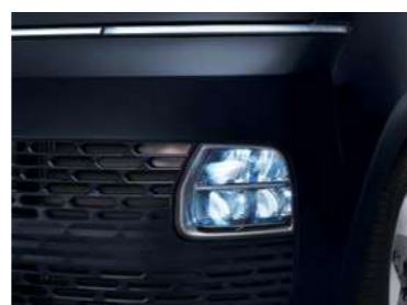
תאורת LED קדמית*