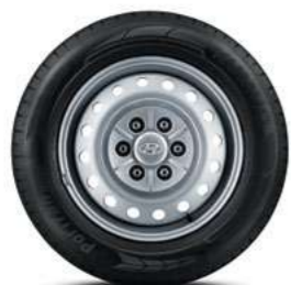
צלחות קישוט 17" (דגם מסחרי בלבד)