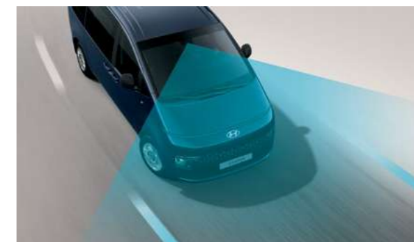
מערכת סיוע לשמירה על מרכז נתיב הנסיעה (LFA) מערכת אקטיבית המסייעת בשמירה על מרכז נתיב הנסיעה.