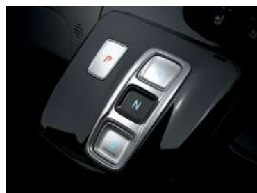
SBW (Shift By Wire) בחירת הילוך נסיעה בכפתור*