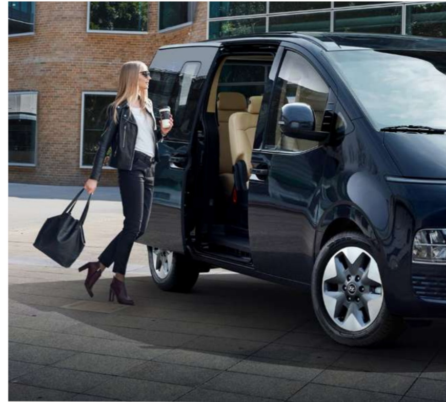
מפתח רחב הדלתות ביונדאי סטאריה מעוצבות בצורה המאפשרת כניסה ויציאה נוחה ונינוחה במיוחד.