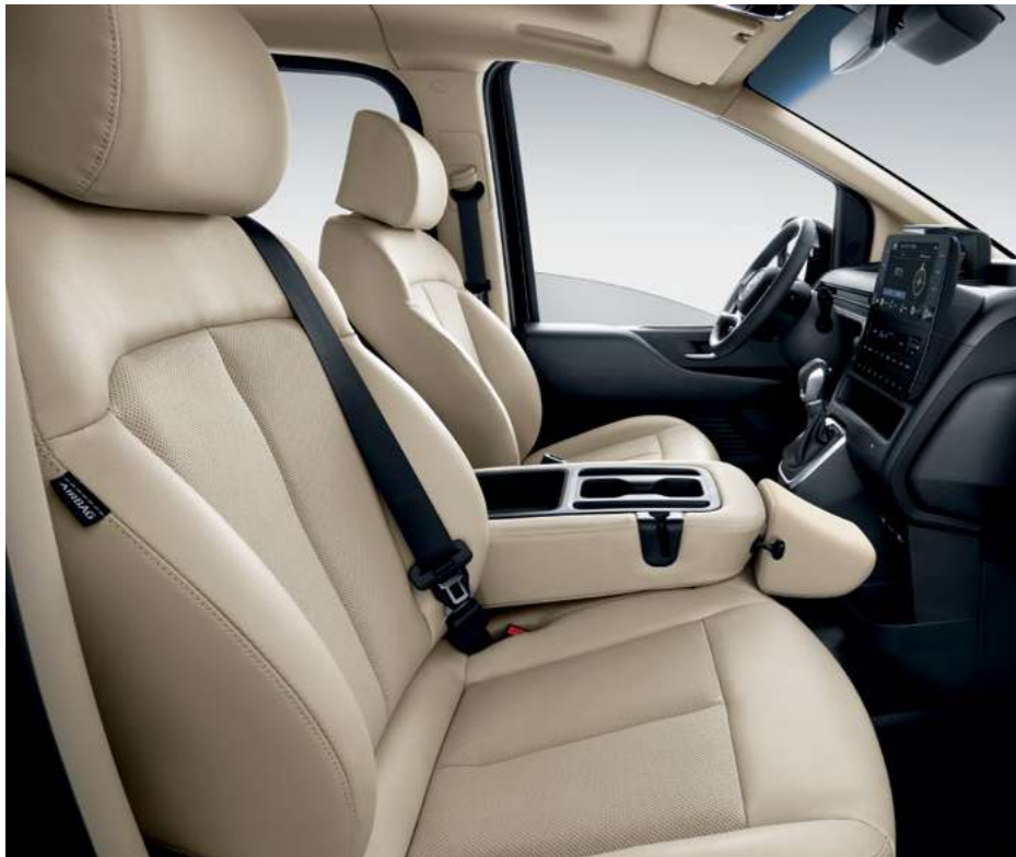
קונסולה מרכזית הניתנת להרמה והפיכתה למושב נוסע נוסף.

ליונדאי STARIA שפע תאי אחסון ומאפייני נוחות שימושיים בחלל הפנימי, כגון מערכת המולטימדיה המתקדמת ומערך מצלמות היקפיות. למכונית מתקדמת מגיע אבזור מתקדם.