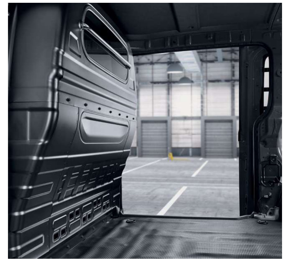
דלת תא מטען כפולה הנפתחת לצדדים ומשטח הטענה באורך 2.5 מטר.