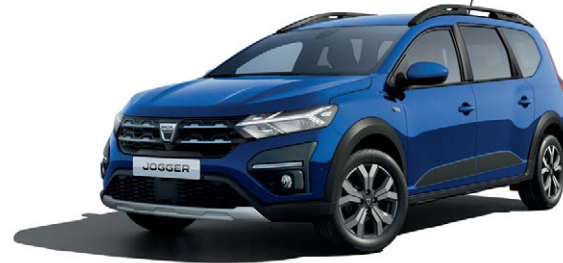
כחול בהיר מטאלי (RQH)