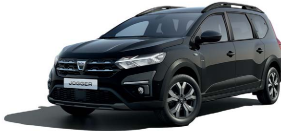
שחור פנינה מטאלי (676)