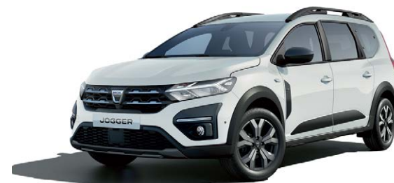
לבן קרח (369)