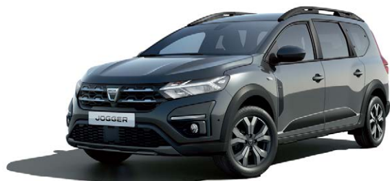
אפור מטאלי (KNA)