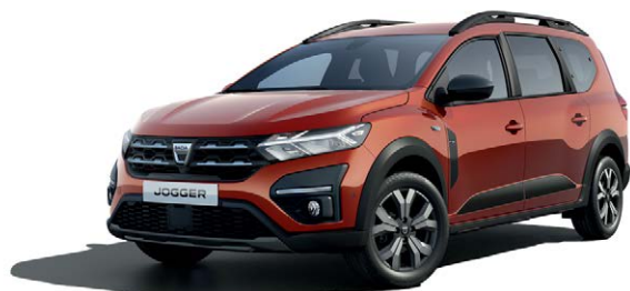
חום אדמה מטאלי (CNZ)