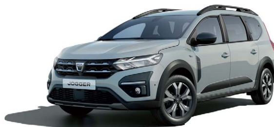
כסף מטאלי (KQF)