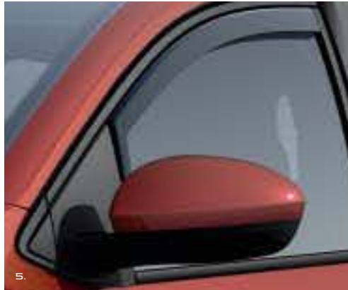
5. מסיטי רוח