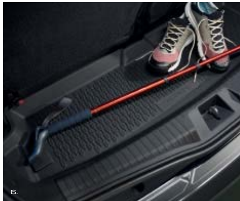
6. שטיח גומי לתא מטען