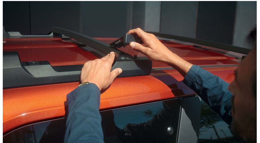
קורות גג מודולריות