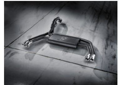
אגזוז Record Monza עם ווסת FreeFlow לזרימה חופשית