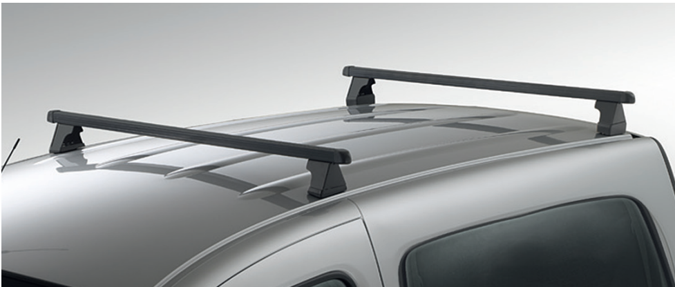
גגון פלדה 2 מוטות רחביים על גג הרכב, לנשיאת מטען של עד 75 ק"ג. LP00008920 מקורי