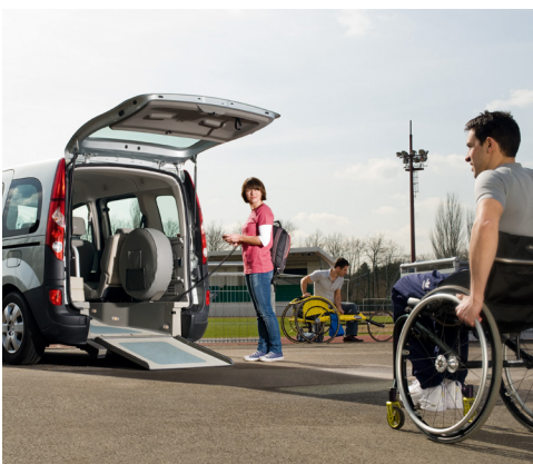
אפשרות להכשרת הרכב להסעת נכים התמונה להמחשה בלבד מקורי