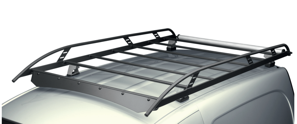
גגון ערסל פלדה אוורודינמי מקורי מעניק שטח אחסון נוסף להובלת ציוד. בעל גלגלת עזר מובנית בחלק העליון להעמסה קלה ונוחה. LP00008408 מקורי

האביזרים המופיעים בעמוד זה הינם בתשלום נוסף.