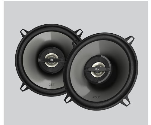
זוג רמקולים אחוריים איכותיים LP00007092