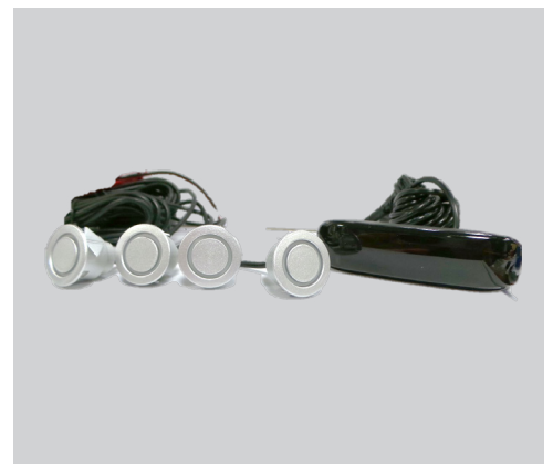
מערכת התראה - חיישן רוורס 4 חיישנים צג רגיל התראה ויזואלית באמצעות צג LCD המורכב מ-3 צבעים ובמרכזו צג דיגיטלי המציג את מרחק/טווח הנסיעה לאחור. LP00000021