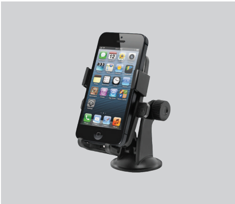
תושבת איכותית לסמארטפון נצמדת לשמשה/לדשבורד, תמיכה במכשירים עד 5 אינץ'. LP00007190