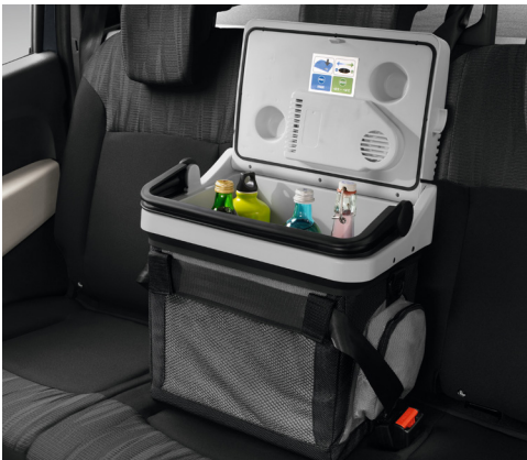
קירורית ניידת 20 ליטר, חיבור למצת הרכב, 12 וולט. LP00011541 מקורי