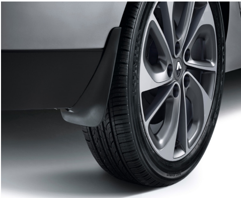
סט מגיני בוץ מגן על הרכב מפני נזקי בוץ וחצץ. קדמי LP00008502, אחורי LP00008503 מקורי

אתה מוזמן לאבזר את הרכב שלך ולהפוך אותו לייחודי, עם מגוון אביזרים לבחירה: