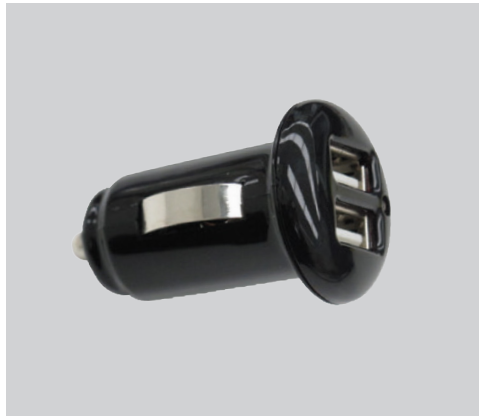
מטען מצת 2.1 אמפר 2 כניסות USB להטענת כל סוגי המכשירים. LP00007192