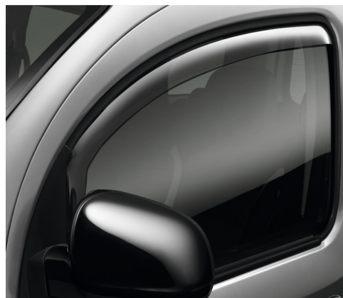
זוג מסיטי רוח לנהיגה בנוחות מלאה עם חלונות פתוחים. LP00008501 מקורי