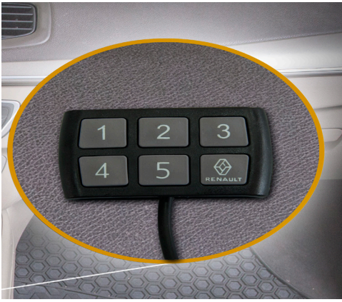
קודן משבת התנעה חכם למניעת גניבות. LP00000045

אתה מוזמן לאבזר את הרכב שלך ולהפוך אותו לייחודי, עם מגוון אביזרים לבחירה: