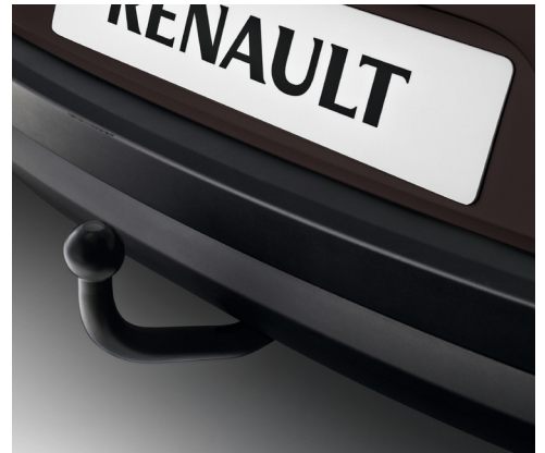
התקן גרר בעל תאימות מלאה לרכב. LP00008380 מקורי