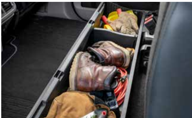
תא אחסון מתקפל נסתר מתחת למושב האחורי