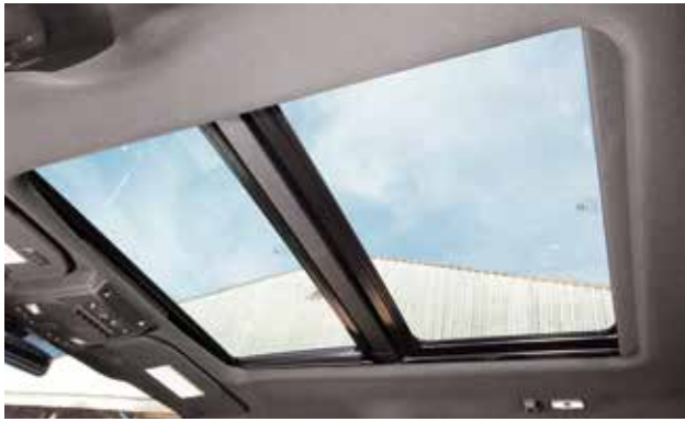
חלון שמש פנורמי Sunroof