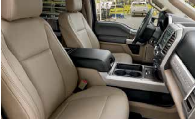
חלל פנימי עשיר ואלגנטי