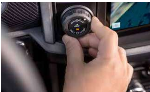
– Ford Pro Backup Assist מערכת עזר לנסיעה לאחור עם נגרר