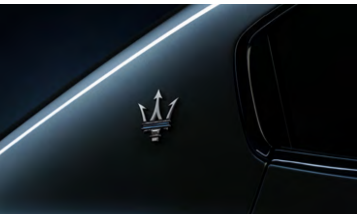
גיבלי GT Hybrid - לוגו Trident על עמוד C