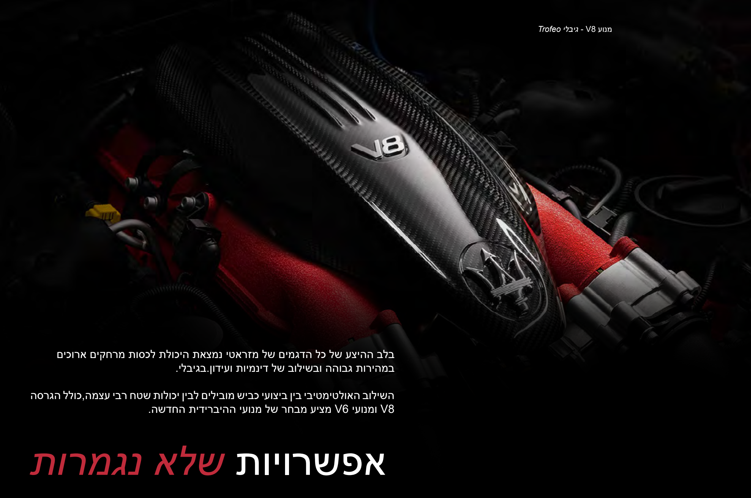
מנוע V8 - גיבלי Trofeo

בלב ההיצע של כל הדגמים של מזראטי נמצאת היכולת לכסות מרחקים ארוכים במהירות גבוהה ובשילוב של דינמיות ועידון. בגיבלי.