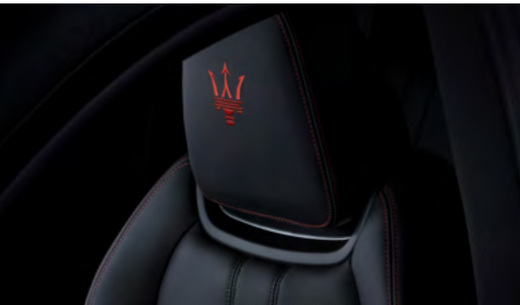
גיבלי - עיצוב משענת הראש