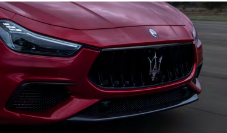
גריל - Ghibli Trofeo

לחיות בתעוזה. לנהוג עם אופי. לבלוט ב-4.3 שניות בלבד עם המזראטי גיבלי Trofeo האולטימטיבית. עם 580 כ"ס ומהירות מרבית של 326 קמ"ש, ה-Trofeo היא הגיבלי החזקה ביותר אי פעם. ההצהרה הנועזת שלכם המגדירה מחדש את אמנות האפשרי. מראה הקופה המרשים של הגיבלי מועצם על ידי מרכיבי עיצוב בהשראת מרוצי מכוניות. סיבי הפחמן המבריקים מלפנים, פתחי האוויר הצידיים והאחוריים עם יציאות אוויר מעניקים לכם רק Trofeo-ומכסה תא המנוע המגולף של ה טעימה ממה שמצפה לכם כשאתם אווזים בהגה שלה. כך הגיעה הגיבלי Trofeo לעולם. נולדה ממרוצים, משופרת באמצעות נוחות, עם חוש מולד ליופי אל-זמני.