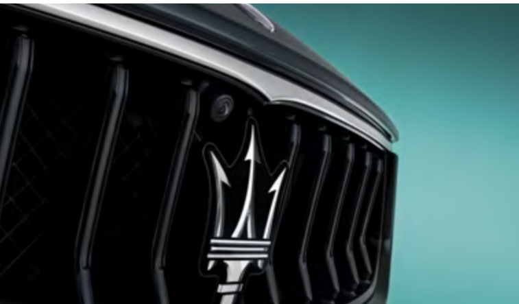
גיבלי - גריל

ללא תלות בבחירה שלכם או בשאיפות שלכם, מזראטי גיבלי תמיד מציעה תשובה מעוררת השראה ייחודית.