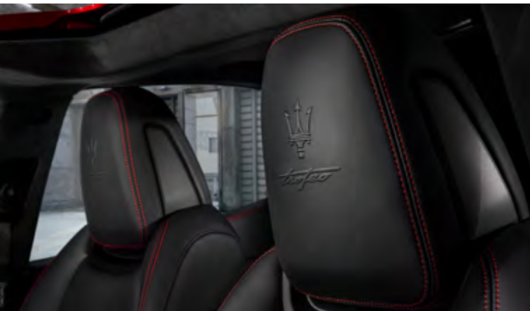
עיצוב משענת הראש - Ghibli Trofeo