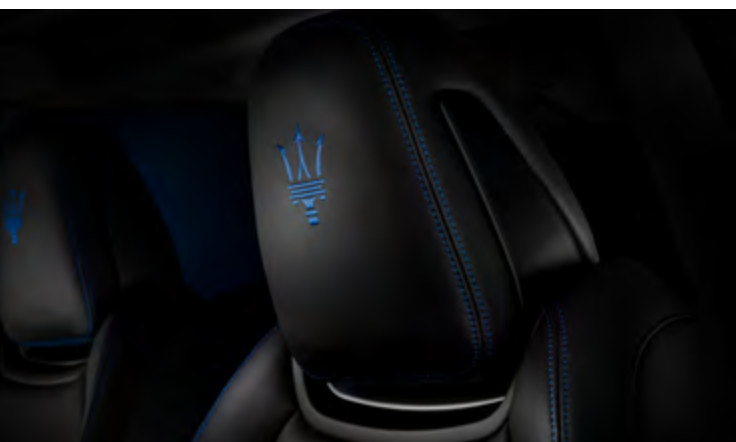
גיבלי GT Hybrid - עיצוב משענת הראש