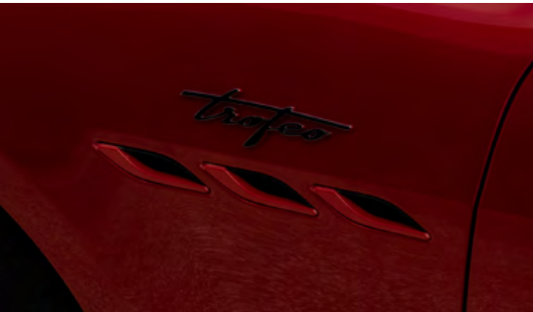
פתחי אוויר צידיים וסמל Trofeo - Ghibli Trofeo