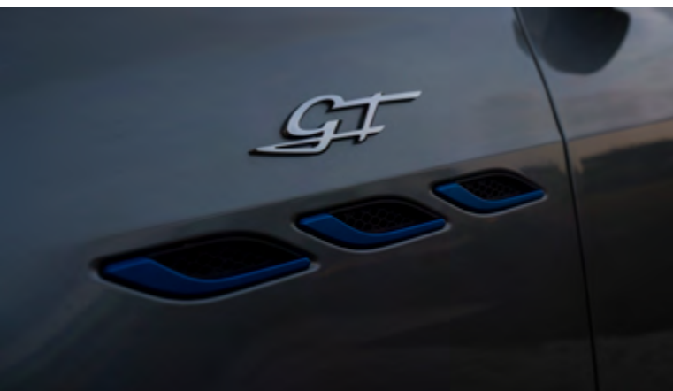
גיבלי GT Hybrid - פתחי אוויר צידיים וסמל GT