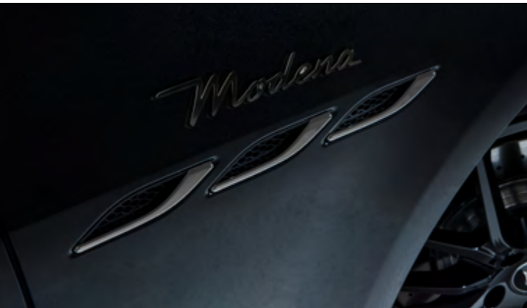
גיבלי - פתחי אוויר צידיים וסמל Modena