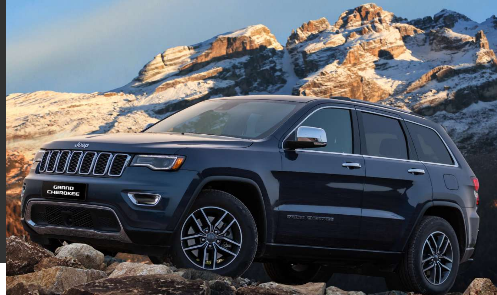
*קוד הדגם ודרגת הבטיחות לדגם LIMITED EDITION טרם נקבעו סופית ויעודכנו עם הגעת הרכב לארץ.