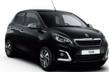
Noir Caldera | XZM0 | שחור