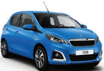
French Blue | QQM0 | כחול