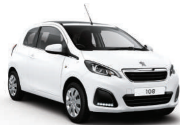
Blanc Lipizan | P8P0 | לבן