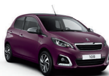
Rouge Purple | LEM0 | סגול מטאלי