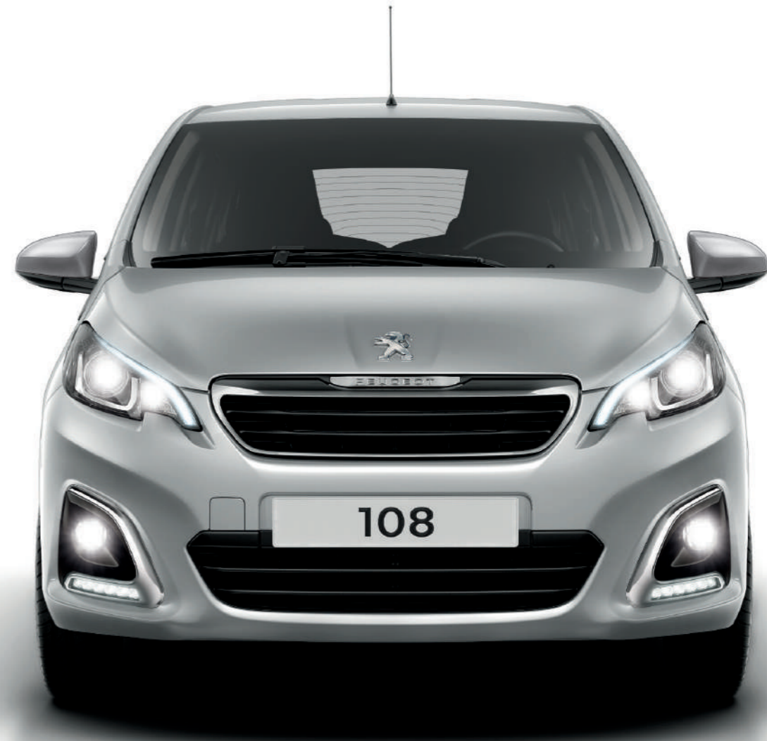
Gris Ghalium | 9BM0 | כסף מטאלי