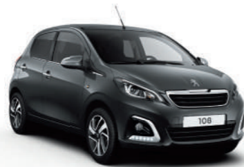
Gris Carlinite | 9AM0 | אפור כהה מטאלי