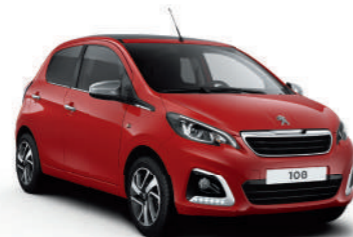
Rouge Scarlet | Y2P0 | אדום