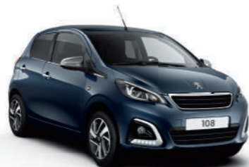
Blue Smalt | LBM0 | כחול מטאלי