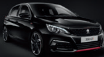
Noir Perla | 9VM0 | שחור