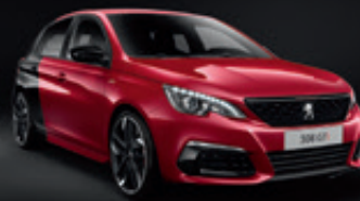
Coupe Franche | D369 & F3M5 | אדום & שחור