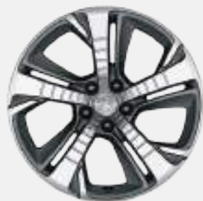
18" DIAMANT diamond-cut alloy wheels *רמת גימור GT