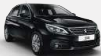
PERLA NERA BLACK | 9VM0 | שחור מטאלי