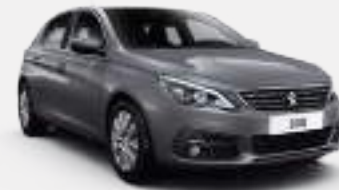
ARTENSE GREY | F4M0 | כסוף כהה מטאלי