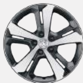
17" RUBIS diamond-cut alloy wheels *רמת גימור PREMIUM