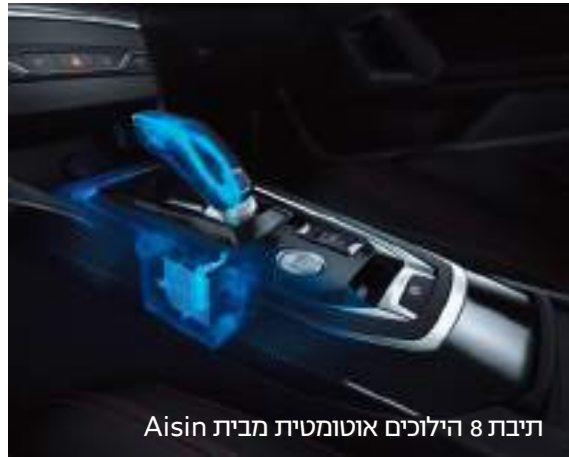
תיבת 8 הילוכים אוטומטית מבית Aisin