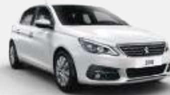
PEARLESCENT | N9M6 | לבן פנינה מטאלי