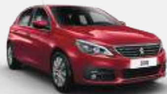
ULTIMATE RED | F3M5 | אדום כהה מטאלי