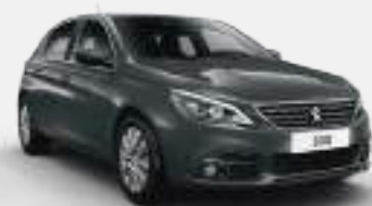
PLATINIUM GREY | VLM0 | אפור כהה מטאלי