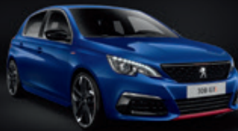
Blue Magnetic | EGM0 | כחול