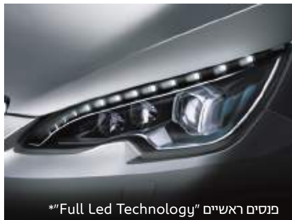
פנסים ראשיים "Full Led Technology"*