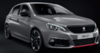
Gris Artense | F4M0 | אפור פלדה