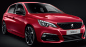
Rouge Ultimate | F3M5 | אדום