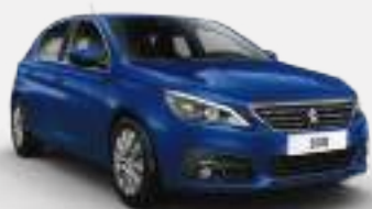
MAGNETIC BLUE | EGM0 | כחול ים מטאלי