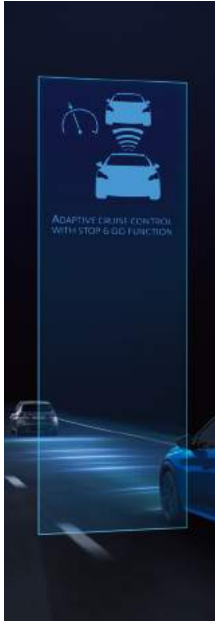
*למכשירים תומכים בלבד