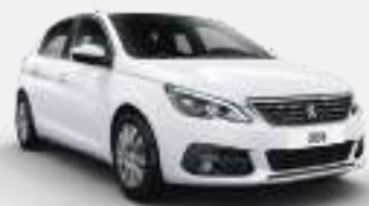
BANQUISE | WPP0 | לבן בנקיז