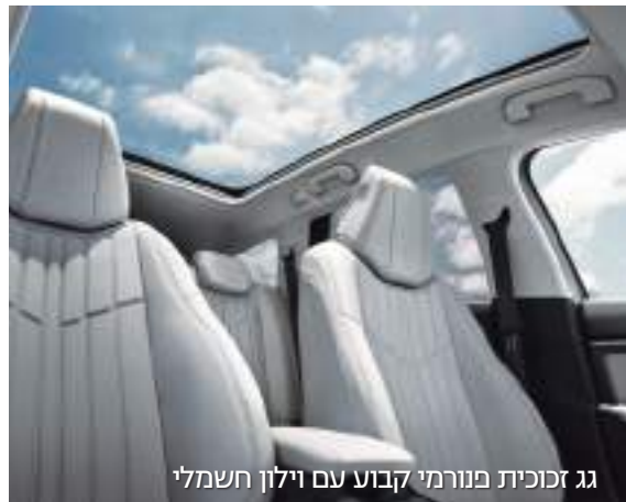
גג זכוכית פנורמי קבוע עם וילון חשמלי