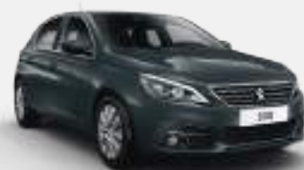
HURRICANE GREY | 9GP0 | אפור כהה