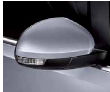
כסף תכלית (9019)