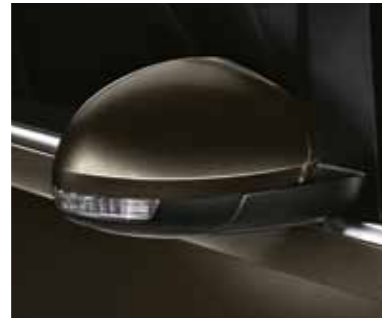
שחור חציל (0000)