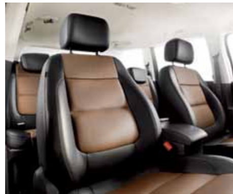
עור שחור חום