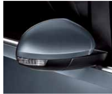
אפור כהה (3333)