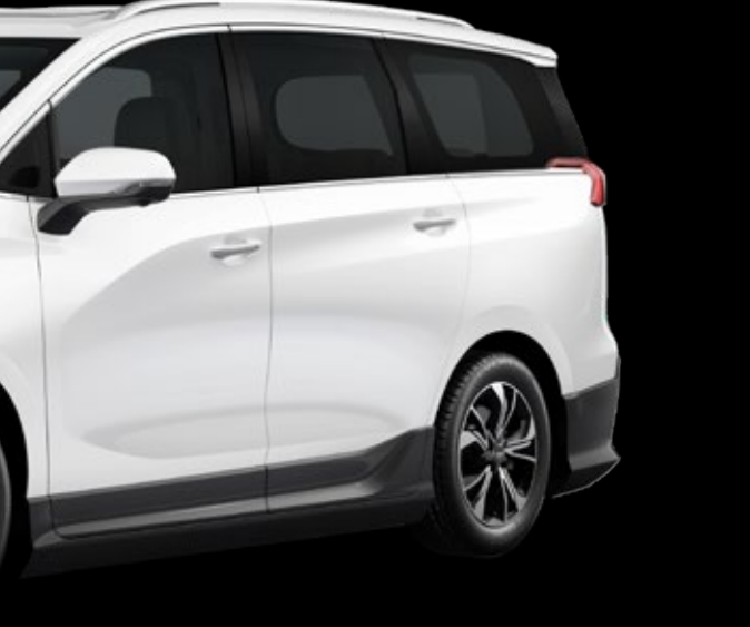
מובהר בזה במפורש ובמודגש כי נתוני טווחי הנסיעה לעיל עשויים להשתנות בפועל בהתאם למספר גדול של פרמטרים, כגון: אופן ואופי הנהיגה, תוואי שטח הנסיעה, אקלים ומזג אויר, מידת העומס ברכב, אבזור הרכב, מידת השימוש במערכתיו השונות של הרכב וכו'.