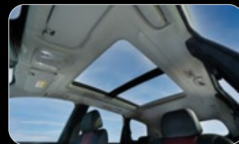
גג פנורמי נפתח