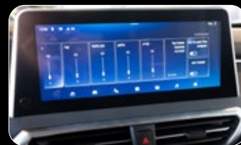
תצוגה מערכת מולטי מדיה בעברית