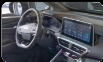
ידיד הילוכים צמודה להגה