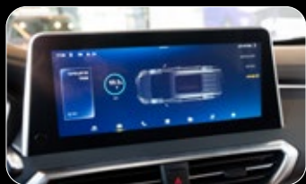
תצוגת אחוז סוללה