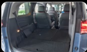
נפח תא מטען מקסימלי (שורה 3 מקופלות)