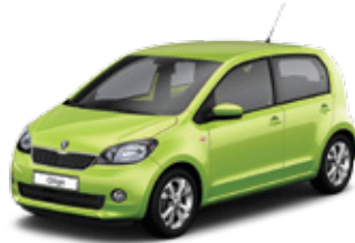
Spring Green metallic - OW