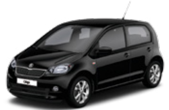
Deep Black metallic - 2T