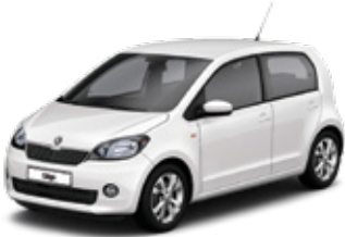
Candy White uni - B4