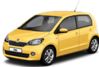
Sunflower Yellow uni - T1