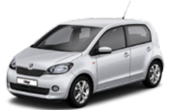
Brilliant Silver metallic - 8E