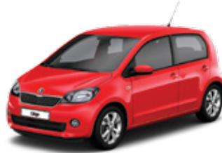
Tornado Red uni - G2