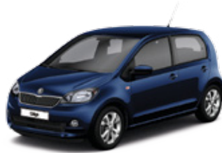
Dark Sapphire Blue Metallic - S8