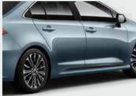
סט פסי קישוט בצבע כרום/שחור - מוסיף נגיעה אלגנטית למראה רכב קלאסי