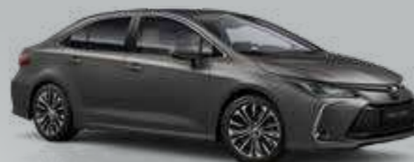
אפור כהה מטאלי 1G3