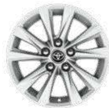
חישוקי סגסוגת קלה 16"