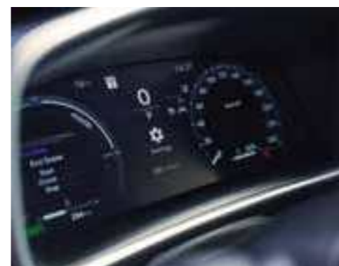
מסך נתונים צבעוני בלוח המחווניים "12.3"