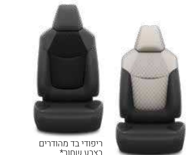
ריפודי בד מהודרים בצבע שחור*