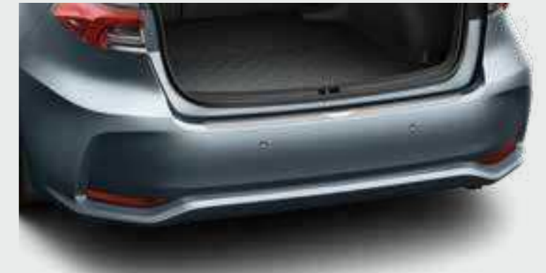
מגן פגוש אחורי