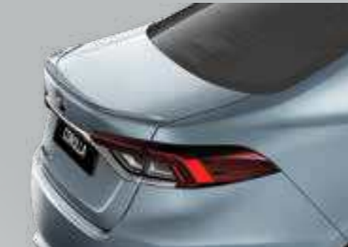
ספויילר אחורי - משולב בצורה מושלמת עם מבנה הרכב ומספק לו מראה ספורטיבי