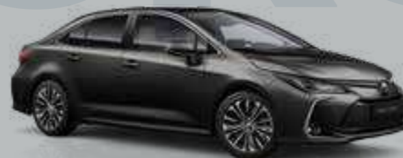
שחור נואר מטאלי 209

הקורולה סדאן מגיעה במגוון צבעים וגוונים. הצבע החדש שמצטרף אלינו הוא האפור כהה השואב השראה מהטרנדים האחרונים בעולמות האופנה, עיצוב ואדריכלות.