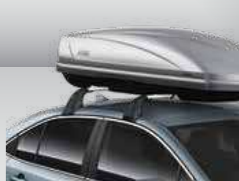
מוטות רוחב - עבור מגוון אביזרי גג ומתקני אופניים