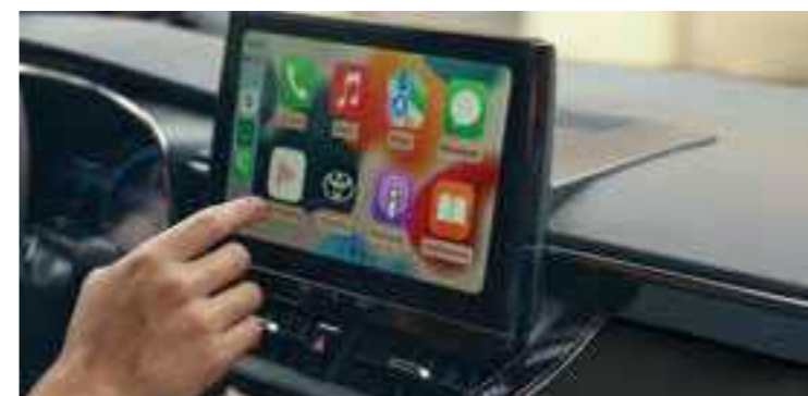
מערכת מולטימדיה עם מסך "10.5"

אנחנו אבזרנו אותה במערכות טכנולוגיות חדשניות כדי שלכם תהיה חוויית נהיגה מושלמת