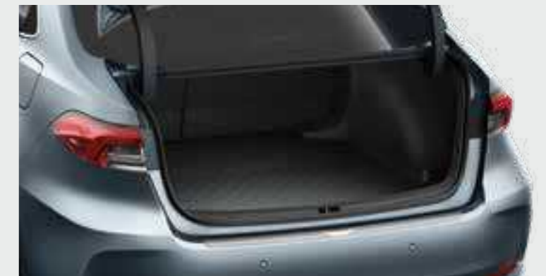
משטח הגנה לרצפת תא המטען