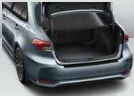
משטח הגנה לתא מטען - מספק הגנה מפני לכלוך והחלקה של ציוד וסחורה