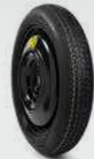
ערכת גלגל רזרבי וקומפקטי לניצול מקסימלי של נפח תא המטען