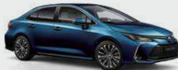
כחול טורקיז מטאלי 785