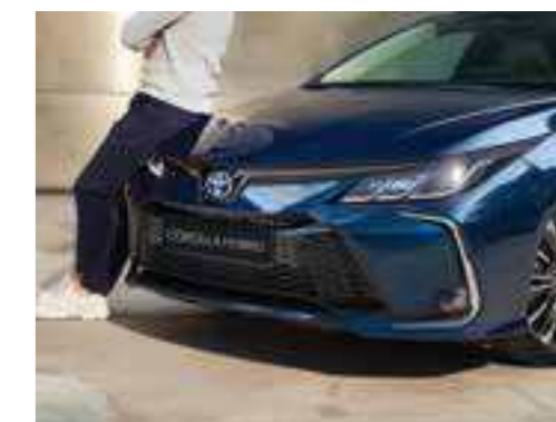
כיבוי תאורה מושהה FOLLOW ME HOME