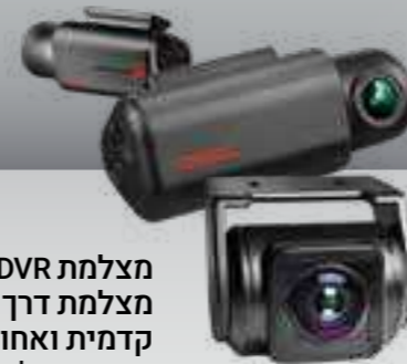
מצלמת DVR מצלמת דרך קדמית ואחורית מתעדת כל אירוע בכביש