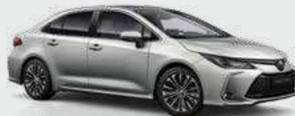
כסוף מטאלי 1L0