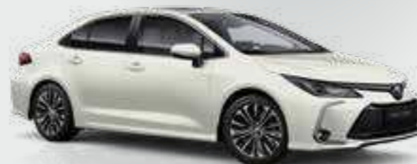
לבן פנינה מטאלי 089