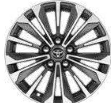
חישוקי סגסוגת קלה 17"

*כפוף לתאימות הטלפון הנייד שברשותך להתקן ה-Bluetooth ברכב. **נכון למועד פרסום קטלוג זה, אפליקציית Android Auto אינה זמינה בישראל. ***כפוף לתאימות הטלפון הנייד למשטח הטעינה. ****פעילות ה-E-Call תלויה ברשת הסלולרית הנמצאת בקרבת הרכב בעת שידור המידע