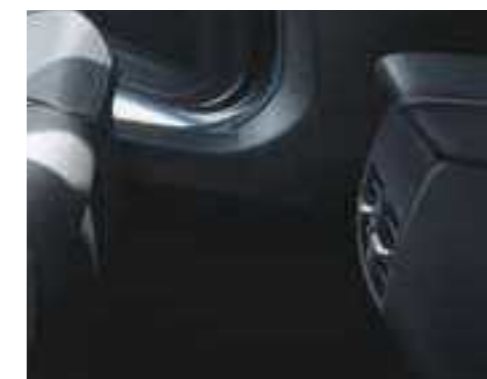
פתחי מיזוג אחוריים ליושבים במושב האחורי