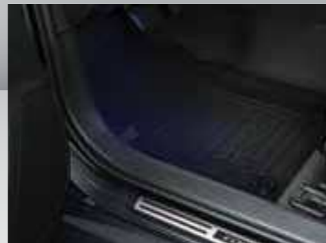
סט שטיחי גומי - מספקים הגנה על פנים הרכב מפני לכלוך, ניתנים להסרה לניקוי קל ופשוט