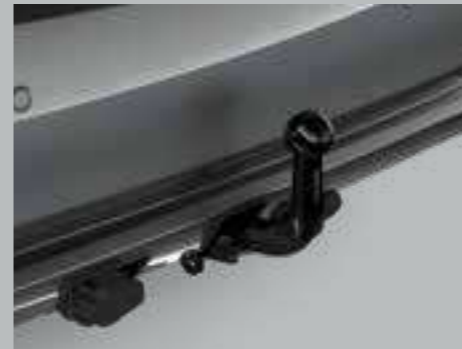
וו גרירה מקורי נשלף - מספק כושר גרירה ומאפשר התקנה של מתקן אופניים אחורי