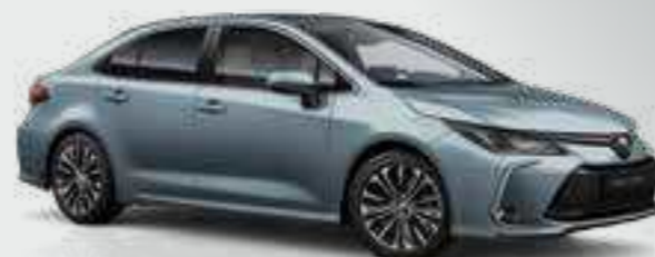
אפור תכלת מטאלי 1א3