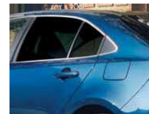
שמשות אחוריות כהות*