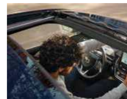
חלון שמש נפתח חשמלית (Sunroof)*