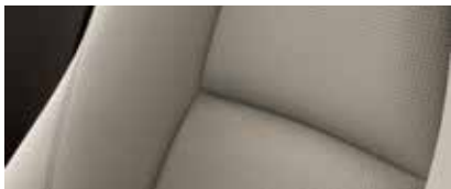
ריפוד בד בז'