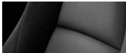
ריפוד בד שחור